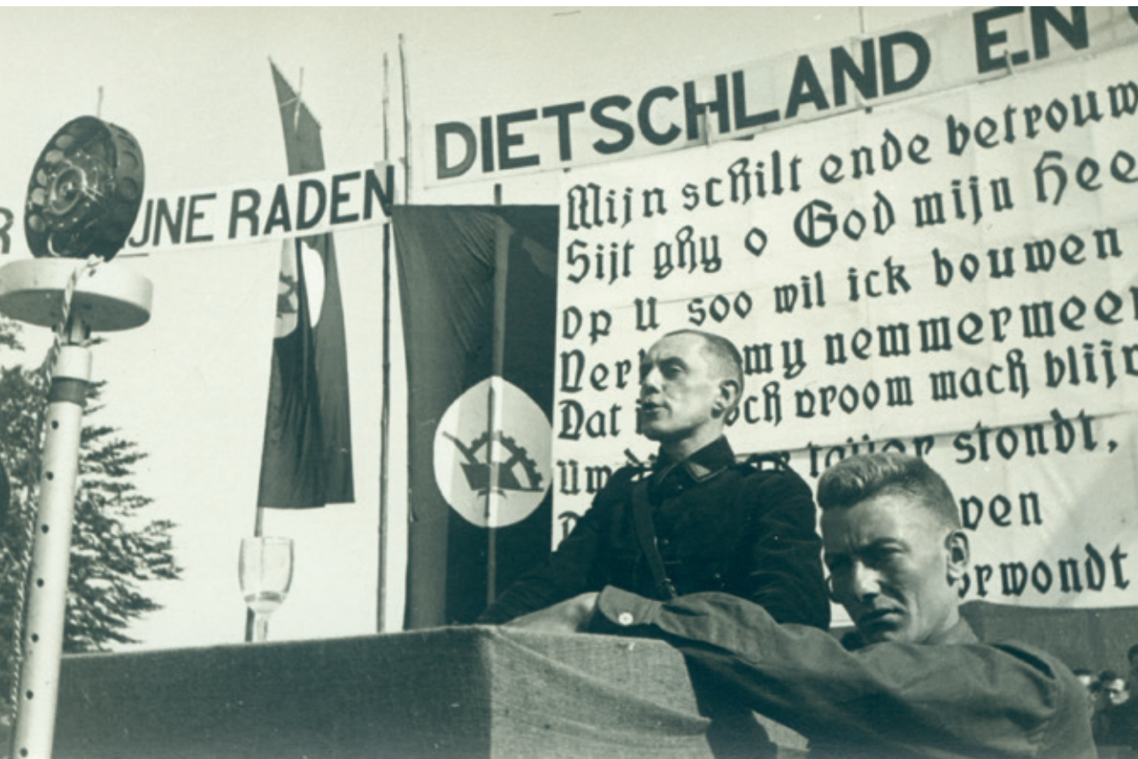
^ Joris Van Severen houdt een toespraak tijdens de vierde Landdag van het Verdinaso in Sint-Kruis-Male op 4 augustus 1935