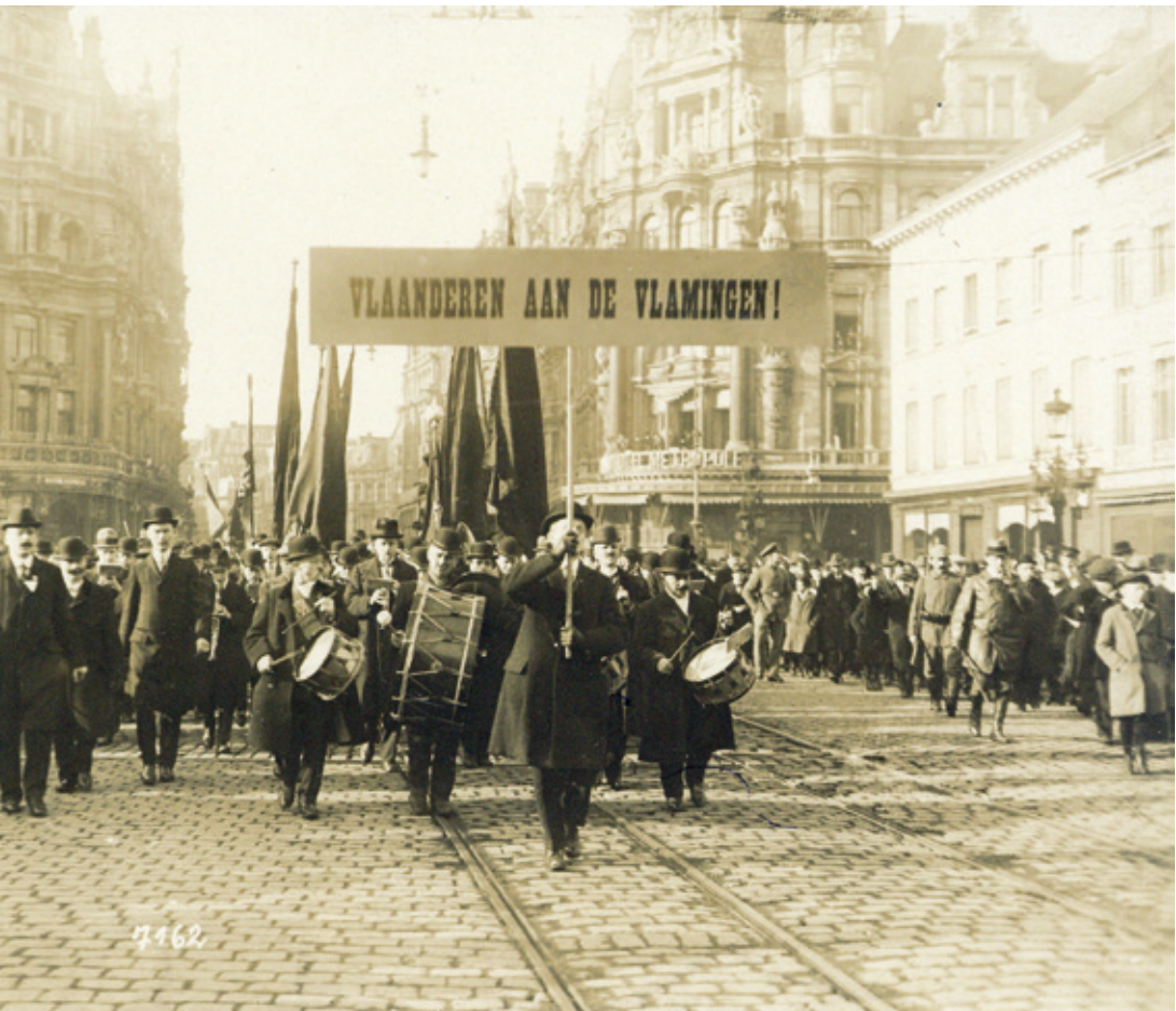
^ De 'volksraadpleging' in Antwerpen op 3 februari 1918