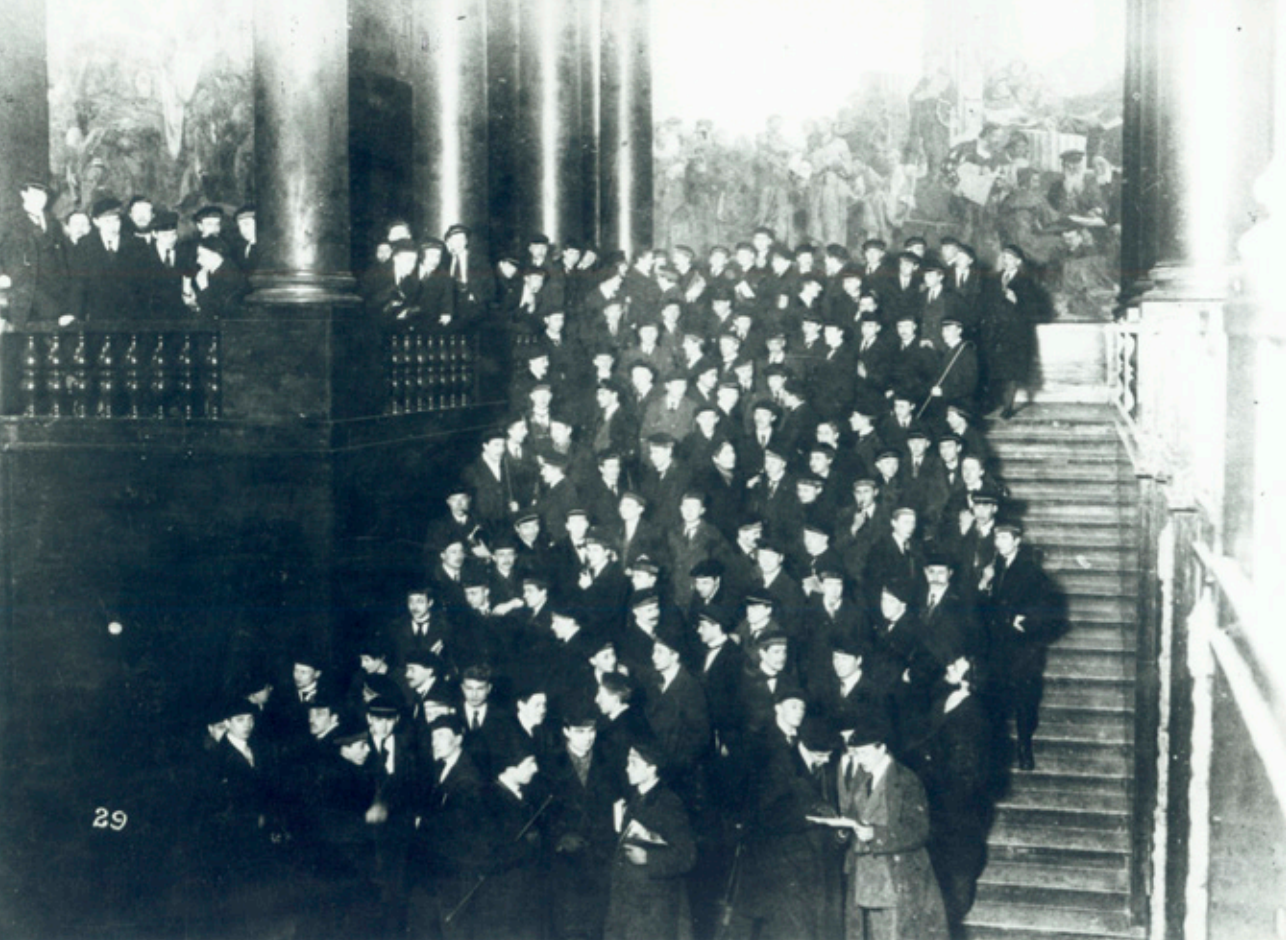
^ De von Bissing universiteit aan de start van het tweede academiejaar (1917-1918). Wandelende studenten in de zuilengaanaderij van de Aula in Gent.

bracht ze inderdaad een zekere doorbraak in de Vlaamsgezinde opinie, wat toeliet om in februari 1917 het beoogde activistische comité te stichten, onder de benaming Raad van Vlaanderen. Die Raad had zo weinig aanhang bij de bevolking, dat hij in volledige anonimiteit moest werken. Maar toch heette het op zijn verzoek te zijn dat vanaf februari tot in juni 1917 de Belgische ministeries achtereenvolgens werden gesplitst, in Vlaamse met Brussel als hoofdstad, en Waalse met Namen. Het geheel kreeg nog meer het uitzicht van de vorming van twee deelstaten, door een splitsing van de Duitse Verwaltung , die voor Wallonië ook naar Namen zou worden overgebracht. In augustus volgde een verordening die het gebruik van de Nederlandse taal oplegde aan alle overheidsdiensten in Vlaanderen.