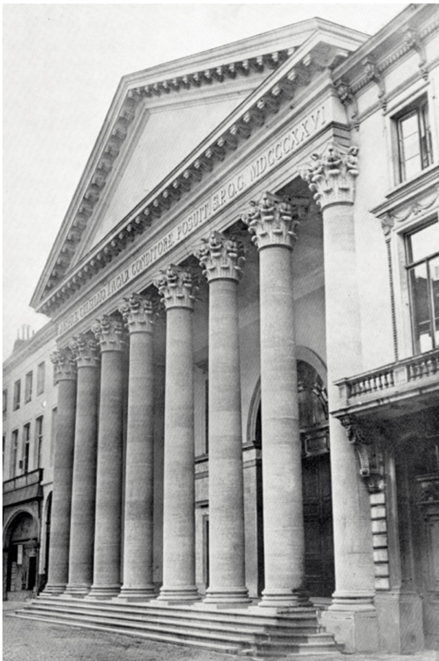
De aula van de Universiteit Gent. Uit: Gedenkboek van de Rijksuniversiteit te Gent. Na een kwarteeuw vervlaamsing (1930-31 – 1955-56) , Gent, 1957, p. 2. [ADV, VB13199]