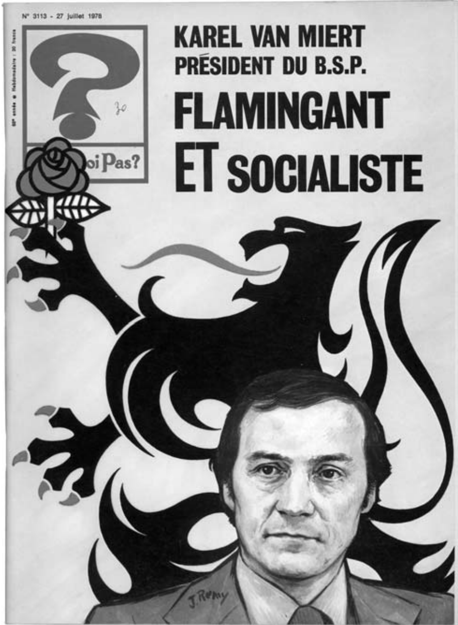
Cover van Pourquoi Pas? jg. 68, 1978, nr. 3113.