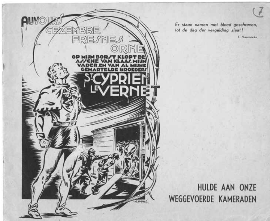
Programmabrochure Hulde aan onze weggevoerde kameraden, Antwerpen, 1940.