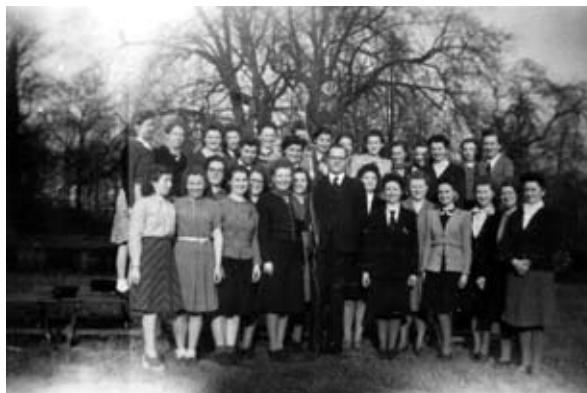
Hendrik Elias met leden van het Vlaams Nationaal Vrouwenverbond (VNVV) in de tuin bij het kasteel van Wieze tijdens een studieweek van het VNVV in 1943.

over het gevaar van verduitsing, geen verzoening moest worden nagestreefd “met talrijke elementen en groepen uit het Belgische kamp (...) op basis van een federaal statuut, dat ons de mogelijkheid waarborgen moet ons als Vlamingen uit te leven binnen het Belgische verband en, wie weet, later in een ruimer verband, waartoe ook Nederland behoren zou, wellicht met Leopold III als koning?” Die vraag werd door bijna alle leden van de Raad bevestigend beantwoord. Maar de Militärverwaltungschef Reeder waakte. Op 22 augustus kapittelde hij vijftien vooraanstaanden uit het Vlaams-nationalisme, die hij had samengeropen met evenveel ss- en DeVlag-aanhangers (die hij dus duidelijk op gelijke voet plaatste): plannen voor de naoorlog moesten uitsluitend aan de Führer worden overgelaten, en overtreders werden met gevangenis bedreigd. In de Raad van Leiding van 30 augustus zou Edgard Delvo met overtuiging concluderen dat het enige wat er te doen stond, was: zich honderd procent inzetten voor de Duitse overwinning. 23 Zo zou het gebeuren, door sommigen met groeiende wrevel.