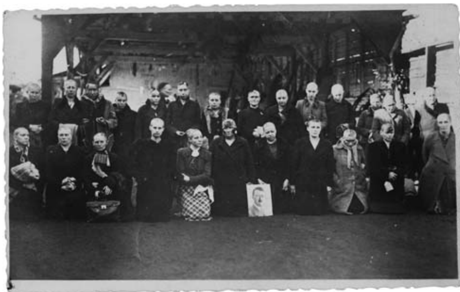
Groep van collaboratie betichte vrouwen, kaalgeschoren en met hakenkruis op het hoofd geschilderd, met een portret van Adolf Hitler. [ADV, VFA3683]