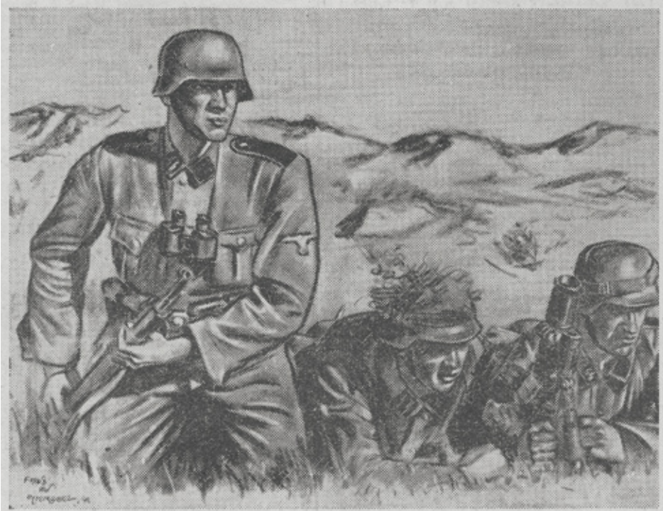
« Granaatwerpers schiet klaar ! » — De troepleider overschouwt het schietveld. (Teekening S.S.-P.K. Frans Van Immerseel).