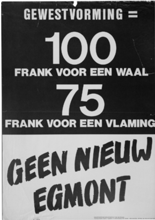
Affiche van het Egmontkomitee, s.d.

voorzitters meteen een nieuwe Egmont-regering op de been brengen, onder de leiding van Martens. Maar de diepe verscheurdheid binnen de CVP, de controversiële positie van Martens zelf, het isolement van Tindemans en de 'contrareformatie' van de buitenparlementaire Vlaamse beweging lieten dat niet toe.