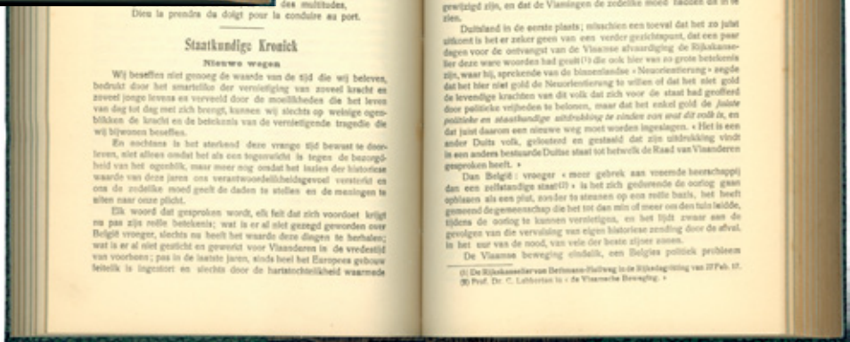
Cover van het tijdschrift Aula , jg. 1, 1917, nr. 6 met in het tijdschrift de rubriek Staatkundige kroniek door Robert Van Genechten.