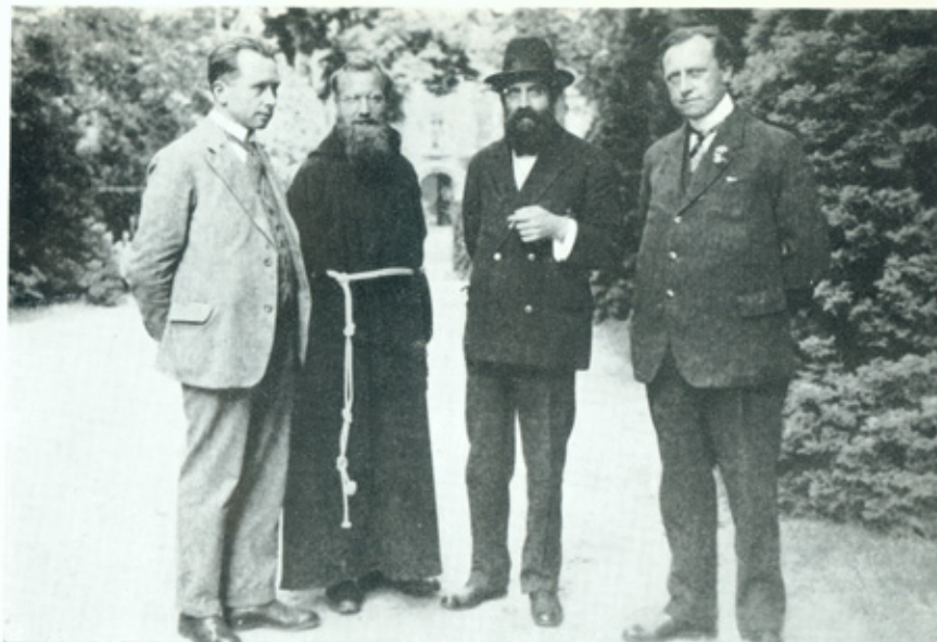
BUREEL VAN DE KATHOLIEKE VLAAMSE LANDBOND