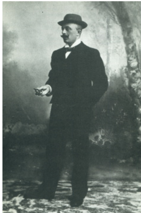
Koning Albert I en koningin Elisabeth (linksboven), Edmond Picard (rechtsboven), Emile Verhaeren (linksonder) en Cyriel Buysse (rechtsonder).