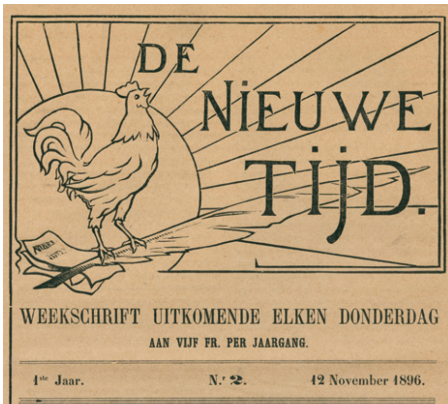
^ Kop van De Nieuwe Tijd, nr. 2, 1896.

in West-Vlaanderen “op een eenzame hoogte”, er verscheen “in de provincie geen enkel weekblad dat zo uitgesproken progressief was”. (pp. 381-383) Het verdedigde de arbeidersreizen van Arthur Verhaegens Belgische Volksbond en vormde als het ware een Nederlandstalige versie “van de ‘Justice Sociale’ van de Brusselse christendemocraat Henry Carton de Wiart”. (pp. 385-386)