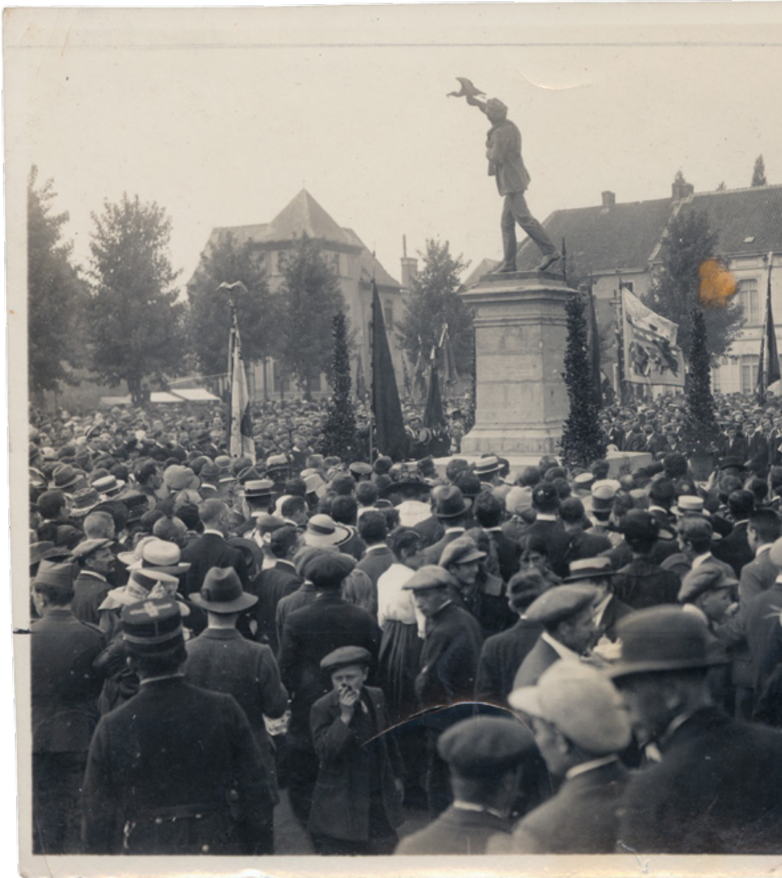
^ Zicht op de aanwezigen en op het standbeeld van Albrecht Rodenbach bij de nieuwe onthulling van het beeld in Roeselare, 1919.