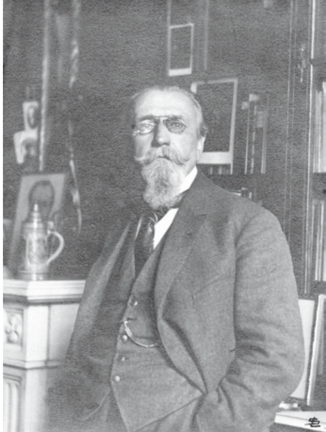
^ Pol De Mont in zijn werkkamer op zijn 70ste verjaardag, 1927.