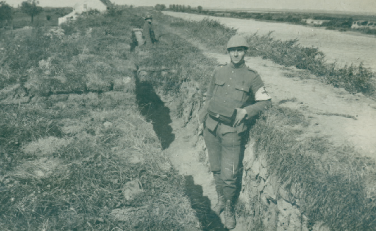
^ Brancardier in een loopgraaf aan het IJzerfront, s.d.