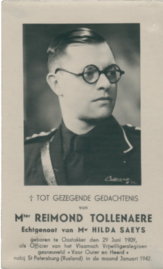
< Het iconische bidprentje van Reimond Tollenaere.

politicus volop in als wapen in de concurrentieslag met andere collaborerende organisaties – in de eerste plaats de DeVlag – om zoveel mogelijk vrijwilligers te ronselen voor het Vlaamsch Legioen, het regiment van de Vlaamse oostfrontsoldaten. 25 In Volk en Staat en andere periodieken die van het VNV uitgingen, werd Tollenaere heengaan keer op keer voorgesteld als een noodzakelijk en exemplarisch 'offer van het nieuwe Vlaanderen in den strijd tegen het bolsjewisme'. 26 Het NSJV-ledenblad De jonge nationaalsocialist presenteerde Tollenaere vanaf diens dood als een onbuigzame supersoldaat en onbetwistbaar rolmodel voor de jeugd: "hij marcheerde ook hier voorop, de eerste in het Legioen, de eerste in den aanval. Tot in den dood ging hij voor." De man die bij leven met zijn opzweepende speeches de "roepstem van het soldateske Vlaanderen" was geweest, en de drijvende kracht achter de oostfrontcampagne van het VNV, had aan het front bewezen