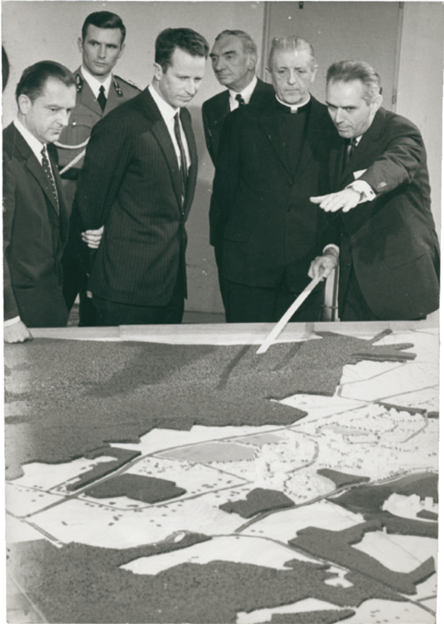
^ De overheveling is besloten: de UCL zal verhuizen. Op 2 februari 1971 krijgen koning Boudewijn en kardinaal Suenens toelichting van prof. R.M. Lemaire voor de maquette van Louvain-la-Neuve. [ADV N, VFB 1993]