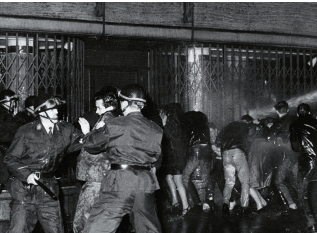
^ Confrontatie tussen betogende Vlaamse studenten en de rijkswacht in Leuven op 27 april 1967.

en de toegenomen vijandigheid tussen beide taalgroepen, er inderdaad twee autonome universiteiten in dezelfde stad konden functioneren. Dat zou in Leuven tijdens het academiejaar 1966-67 duidelijk worden. De bisschoppen lieten niets meer van zich horen. De politici al evenmin, want onder de katholiek-liberale regering Vanden Boeynants (1966-1968) bleef de communautaire problematiek twee jaar lang bevroren. 63 Pas op het einde van het academiejaar moest De Somer tot de conclusie komen dat er door de onwil en tegenwerking van Franstalige zijde geen loyale afspraken gemaakt konden worden en het samen functioneren in één infrastructuur (stad en gebouwen) van twee elkaar vijandige instellingen eigenlijk onmogelijk was.