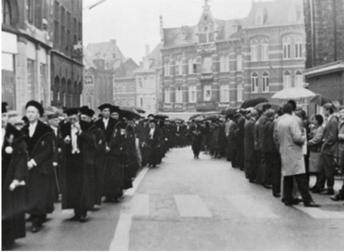
< Openingsstoet aan de Leuvense universiteit op 4 oktober 1966: de Vlaamse studenten keren misprijzend hun rug naar de academische stoet, onder het zingen van We shall overcome , Dies irae en het scanderen van “ la Belgique: hahaha ”. [ADV, VPA 84]

denten uit protest hun rug naar de academische stoet met Descamps en Leemans, onder het spottend zingen van het Dies Irae of het Tantum Ergo afgewisseld met de kreten ‘ Walen buiten ’, ‘ Leuven-Vlaams ’ en ‘ La Belgique: ha ha ha! ’ ingebed in een steeds weer herhaald overtuigend We shall overcome... some day . 50