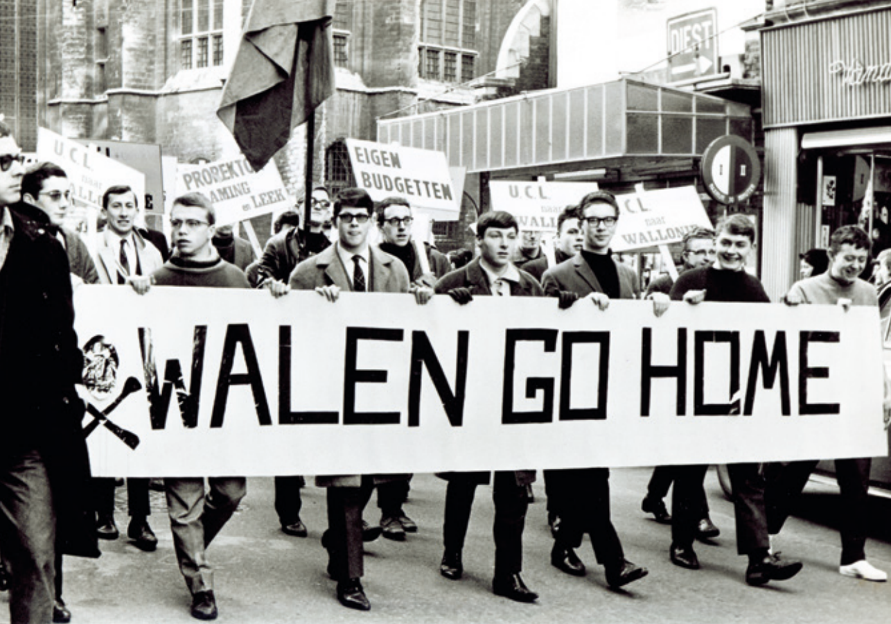
^ Leuven, 15 december 1965: Massale Vlaamse studentenbetoging voor de overheveling van de UCL naar Franstalig gebied. [ADVN, VFA 2203]

hoek van universitaire vestigingen in Waver, Leuven en Woluwe. 24 De Vlaamsgezinden beschouwden dat als een plan voor een verfransing van Vlaams Brabant. 25 De Vereniging van Vlaamse professoren klom in haar pen om te bepleiten dat de enige gezonde oplossing was: 'de Franstalige katholieke universiteit in te planten in Wallonië' en LOVAN – de Vlaamse assistentenvereniging – preciseerde dat het in Namen moest zijn want dat was 'het demografisch zwaartepunt van Wallonië' . Met de oprichting van Aktiegroep Leuven op 19 november 1965 begon de propaganda voor de overheveling van de hele Franstalige afdeling naar Wallonië.