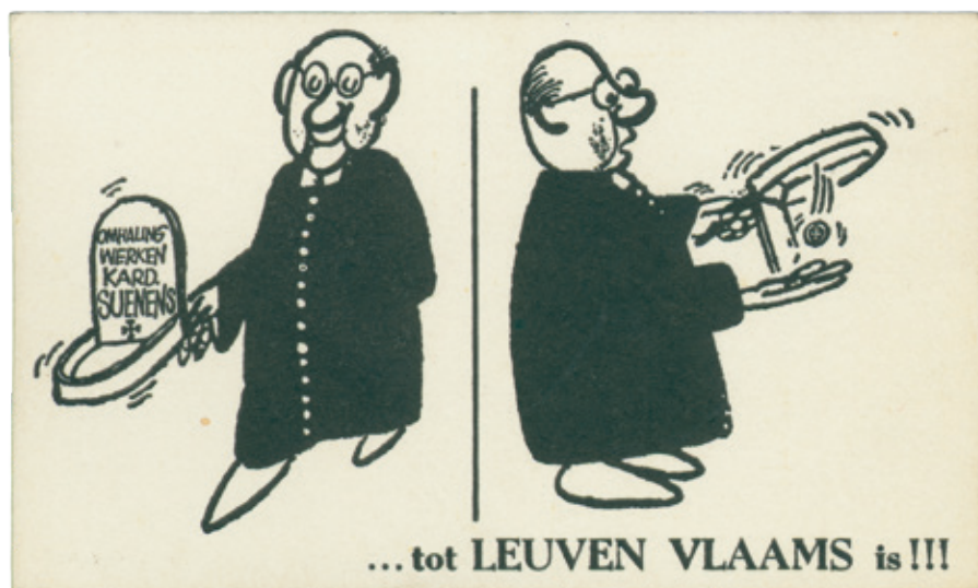
^ 'Omhaling werken Kard. Suenens: geen cent... tot LEUVEN VLAAMS is'. [ADV N, VPA 948]

Toen moet Suenens begrepen hebben dat het aanhouden van een harde lijn niet haalbaar was. De sancties bleven achterwege en hij gaf opdracht het drukken van zijn geplande herderlijke brief stop te zetten. Maar in de publieke opinie bleef hij wel de kop van jut. Zijn pinksterpreek in de kathedraal van Mechelen werd verhinderd door gebrom, de kerkomhaling leverde er vooral nepgeld op met de opdruk: 'geen Vlaams, geen centen!'. Het strijdlied bij de manifestaties was veel minder de Vlaamse Leeuw dan het aan de Amerikaanse burgerrechtenbeweging ontleende We shall overcome , omdat de manifestanten een vage verwantschap voelden met de strijd van de zwarten in de VS. Ook geïnspireerd door dat Amerikaanse voorbeeld was de door Vlaamse studenten georganiseerde zesdaagse 'Meredithmars' van Oostende naar Leuven. Daarin kwam naast de eis van 'Leuven Vlaams' de klemtoon te liggen op de bundeling van alle democratische krachten in universiteit en samenleving tegen het establishment. 48 Elke avond waren er meetings in provinciesteden, o.m. in Mechelen, gevolgd door een spontane betoging voor het aartsbisschoppelijk paleis. 49 Kort daarna, bij de opening van het Academiejahr 1966, waar Suenens niet aanwezig was, keerden Vlaamse stu-