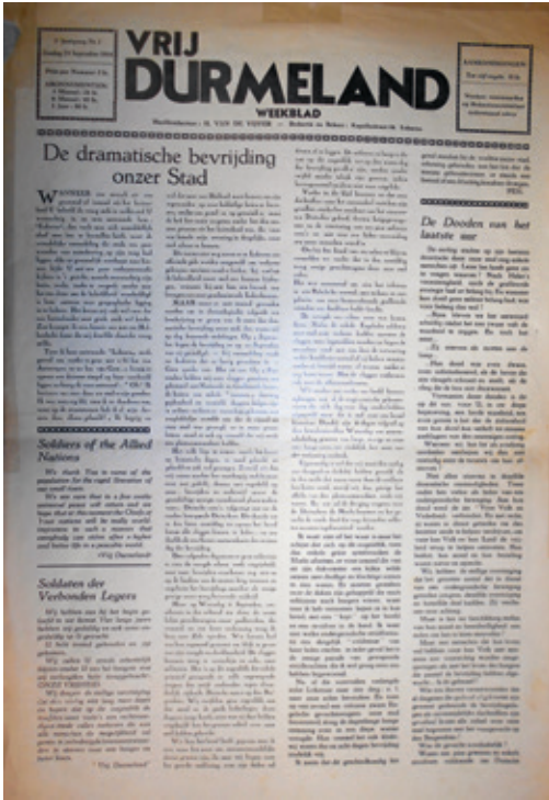
< Titelbladzijde van het eerste nummer van het weekblad Vrij Durmeland.