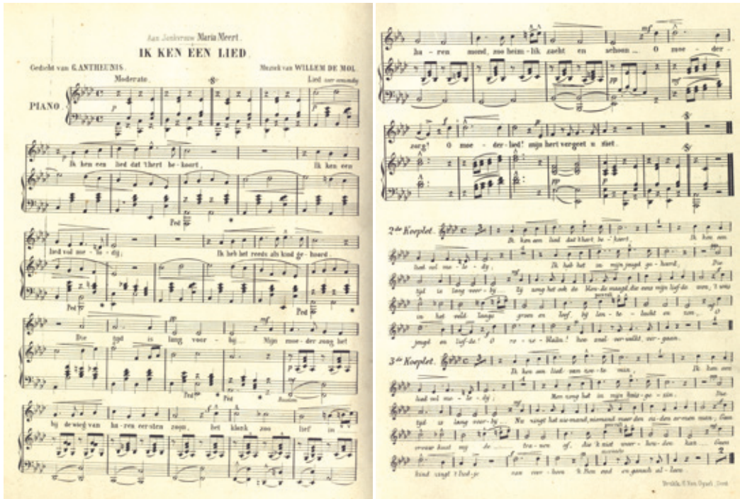
^ Bladmuziek Ik ken een lied , 1871.