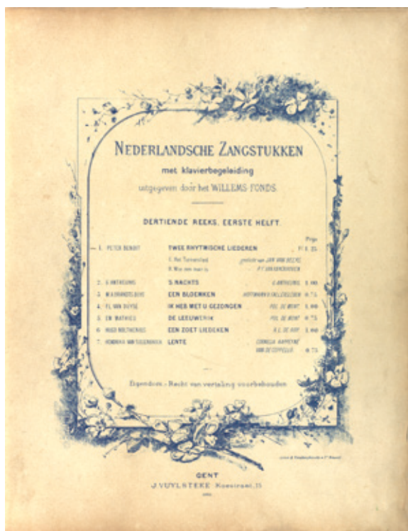
^ Voorblad van de dertiende reeks Nederlandse Zangstukken, 1893.

volgens voorzitters van het Comiteit, maar kenden vooral een algemene erkenning binnen de Vlaamse muziekwereld. Zo was Benoit niet enkel een gevierd componist maar ook directeur van de Antwerpse Muziekschool en publiceerde hij artikels over de nieuwe Vlaamse muziekbeweging. 16 Het Willemsfonds was overigens nauw betrokken bij de strijd tot verheffing van de Antwerpse Muziekschool tot een Koninklijk Vlaams Conservatorium. 17