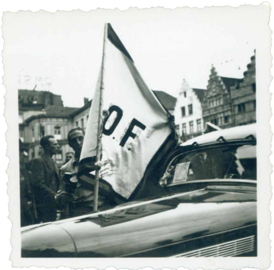
^ Een vlag van het Onafhankelijkheidsfront bevestigd op een auto, vermoedelijk tijdens de dagen van de bevrijding na de Tweede Wereldoorlog. [ADV N, VFA 7206]