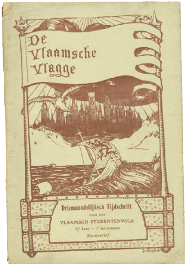
^ Kaftomslag van De Vlaamsche Vlagge . Tekening en ontwerp Joe English, najaar 1910. [ADVN, VY 820]

“Bijlange nog is de strijd in Vlaanderen niet uitgewoed. Al wordt misschien binnen kort het principie van 't Vlaamsch onderwijs erkend, nog houdt de kleingeestige vitterij der Vlaamschhatenden niet op, nog lange jaren blijven taalgrievens heerschen in private en publieke administratie, blijven taalwantoestanden tuschen hoogere en lagere klassen bestaan. Daar moeten wij, studenten, ook een waakzaam oog op nahouden en onrechtvaardigheden blijven aan de kaak stellen. Door 't onstuimige wereltij, zoo vaart de Vlaamsche jeugd met leeuw en kruis in top, ten hoogen hemel op, symbool van innerlijk streven naar zelfvolmaking door 't Christen-Vlaamsch Ideaal. Want wie zal zijne liefde voor Vlaanderen tot hooge werkelijkheid en flinke daden brengen, tenzij deze die gesterkt en gestaald is door een stevige karaktervorming tegen de gevaren van het moderne zinnelijk en wereldsch genotsleven?” 3