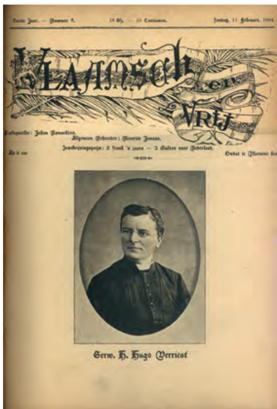
Voorpagina van Vlaamsch en Vrij, 11 februari 1894, met bijdrage omtrent Hugo Verriest.

Sedert Van Duysse is er hoop: wij zijn op weg naar “ vernieuwing, verbreding, vollediging der Vlaamsche literatuur ”. Het nationale leven wordt “ omgeroerd tot op den bodem; de natie ‘werpt zich om’, ook op sociaal en politiek gebied. De tot heden bestaande orde van gedachten verbrokkelt en zinkt weg in het verleden... ” Een deel van Vlaanderen “ is blijven stilstaan bij de taal van Maerlant ” maar nu mag de verwachte verbreding doorstromen. In deze context wordt Gezelle (nog) niet vermeld, tenzij de naam Maerlant een verborgen indicatie inhoudt. Evenmin komt Rodenbach aan bod. Van Langendonck is net