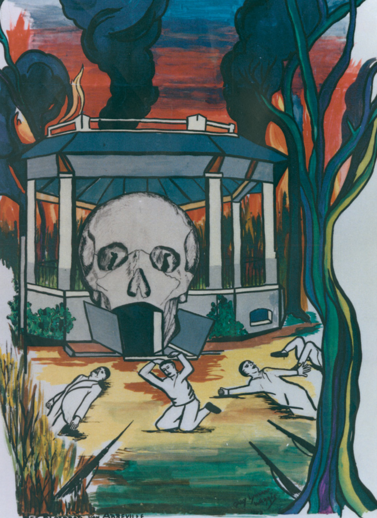
HET BLOEDBAD VAN ABBEVILLE 20 MEI 1940