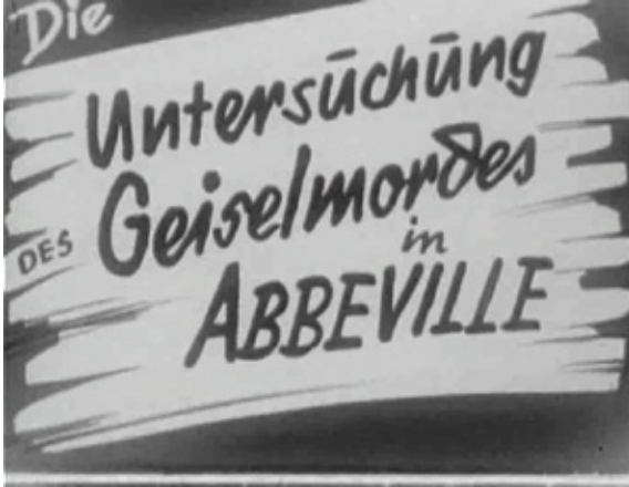
< Titelplaat van de propagandafilm Die Untersuchung des Geiselmordes in Abbeville , 1941. [ADV N, VEF 68]

van Abbeville de opdracht de lijken individueel te herbegraven op het plaatselijke kerkhof. Richard Schneeweiss bleek zich uiteindelijk niet onder de slachtoffers te bevinden en dook niet veel later op in Münster. 13