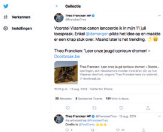
> Tweet van Theo Francken, 2019.