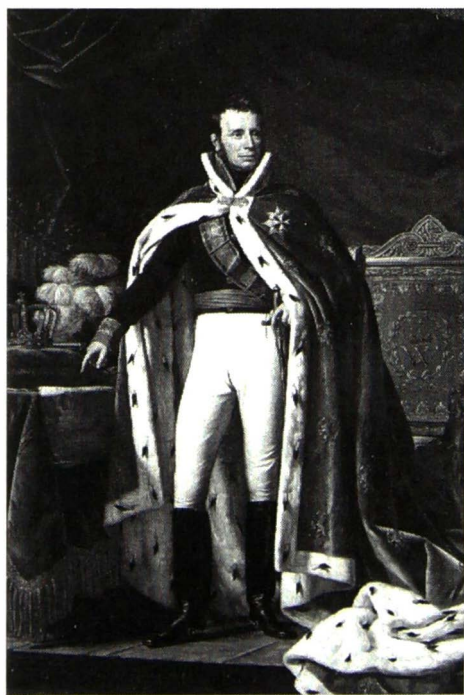
Staatsieportret van Willem I door J. Paelinck in 1819 (Rijksmuseum)

De Bataviaversie waarop de grondwettelijke tekst is vervangen door de landkaart verschilt daarin van andere versies, waaronder een vroegere bestemd voor Den Haag en een latere bestemd voor het stadhuis van Brussel. Op de portretversies voor Brussel en Den Haag wijst de koning naar de grondwet die naast hem op tafel ligt. Met dergelijke portretten wilden koningen in feite hun grondwettelijk gevestigde macht laten zien.