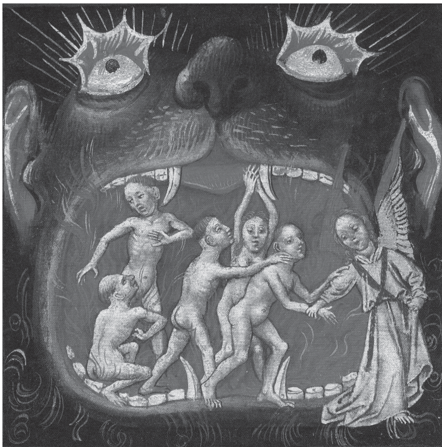
Afb. 1. Een gevleugelde engel leidt een verlostte ziel uit het de (letterlijk) vurige mond van een vreselijk monster: het vagevuur (Noord-Nederlandse miniatuur uit het getijdenboek van Catharina van Kleef, 15de eeuw (Pierpont-Morgan Library, New York).

datzelfde begrip: mortificatio, samengesteld uit de woorden mors (dood) en facere (maken). In het Frans en het Engels werd dat mortification. Versterven mag uiteraard niet verward met de ergste zonde: de zelfmoord of zelfdoding uit wanhoop. In deze korte bijdrage wordt speciaal aandacht besteed aan een uiterst gedetailleerd systeem van aflaten, 'kortingen' op de duur van de vagevuurstraf, zoals aangegeven in een handleiding Schat der aflaten uit 1862 en in een ongedateerd (negentiende-eeuws) boekje in gebruik door de 'Conferenties van Sint-Vincentius'. Dat waren verenigingen van vrome, oorspronkelijk meestal rijke katholieken, Vincentianen genoemd, die aan liefdadigheid deden om een plaatsje te verwerven in het 'Hemelse Rijk'. In beide werkjes wordt uiterst gedetailleerd aangegeven hoe en hoeveel 'aflaten' men kon verdienen.