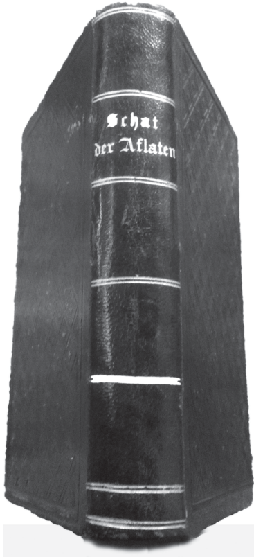
Afb. 5. Samen vormen de tabellen (cf. afb. 3) een niet onaardig boekje, blijkbaar bestemd voor welgestelde katholieke families.

Die aflaat moet men ofwel zelf 'verdienen' of anderen, vrienden en familieleden kunnen dat voor jou doen: door gebeden of andere boetedoeningen. Op die manier kan het vagevuur ook bij de (nog) levende gelovigen zijn nut bewijzen, hielden de predikanten voor. Die levenden konden immers door gebeden en goed gedrag de zielen in het vagevuur helpen door de strafduur te verminderen. Hier komt opnieuw de aflaat op de proppen, nu niet meer in een pecuniaire gedaante, maar als een middel ter zielenverheffing, meer prozaïsch uitgedrukt als een disciplinerend of zelfs edelmoedigheid en liefdadigheid bevorderend systeem.