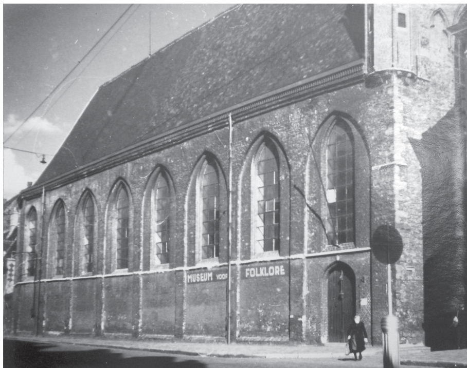
Het Musuem voor Folklore in de Lange Steenstraat.