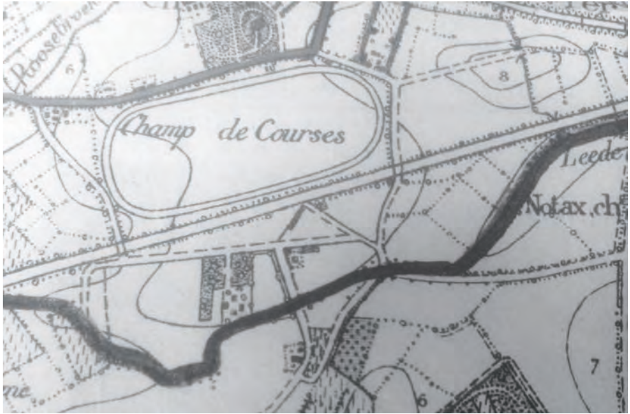
Afb. 3. Bovenaan links van de dik aangegeven Schuurstraat: het hier beschreven 'speelgoed'. Rechts daarvan het omwalde Schuurgoed, eronder het toenmalige paardenkoersplein. De hoekige dikke lijn onderaan is de grens met Destelbergen (militaire kaart 1863, bijgewerkt 1910, kaartenverzameling DSMG, Begijnhof, Sint-Amandsberg).

het goed nog tussen 1900-1910 in het bezit van de familie was.