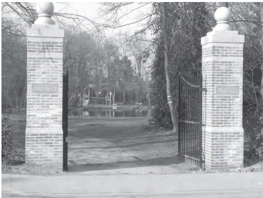
Afb. 6. De heropgebouwde toegangspoort van het kasteel Westveld aan de ingang van het huidige parkje (foto 2017).