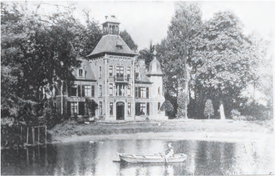
Afb. 4. Het kasteeltje Dupont, een wat groot uitgevallen villa in neorenaissancestijl, met vijver en park.