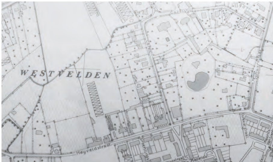
Afb. 5. Centraal op het kaartje de vijver, het kasteel is verdwenen (DSMG: kaart Ministerie Openbare Werken, 1960).

Middelheim. Tegelijkertijd wilde hij ook een jaarlijkse prijs voor beeldhouwkunst instellen. Van zijn plannen kwam er echter niets in huis. De reden laat zich raden: de gemeentelijke financiën.