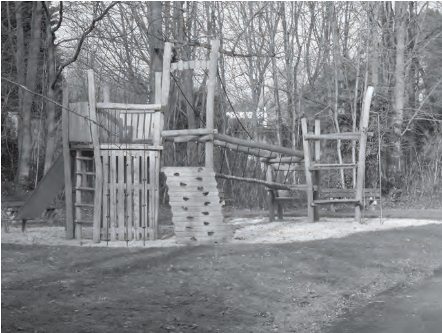
Afb. 7. Een letterlijk speelse evocatie van het verdwenen kasteeltje Dupont in het Westveld-parkje (foto 2017).

Het park werd onlangs heraangelegd door de stad, zodat sociale controle makkelijker wordt. Bij de heraanleg van het park werd de ingangspoort vakkundig verwijderd. De stadsdiensten beloofden de poort opnieuw op te bouwen, wat ondertussen is gebeurd (afb. 6). Op het noordeinde van het park herinnert een speekasteel aan het voormalige Château de Westveld (afb.7). Baron de Schoutheete de Tervarent, wiens familie meer dan een eeuw lang eigenaar was van het kasteel Westveld, was opgetogen met dit stedelijke initiatief.