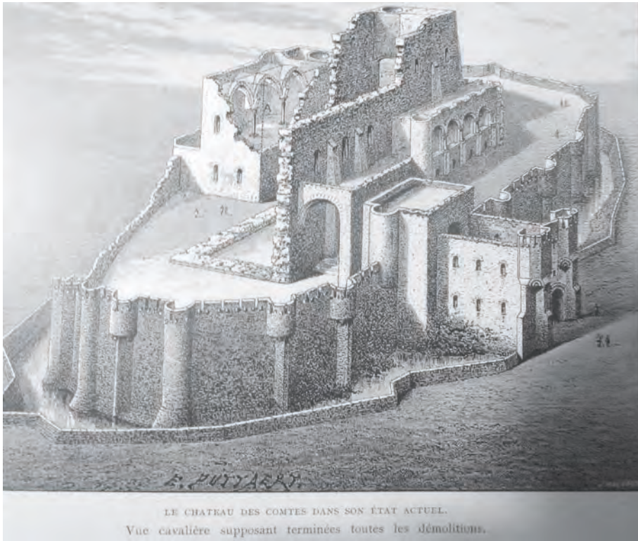
Afb. 3. Het middeleeuwse Gravensteen, ontmanteld en ontdaan van de in andere steensoorten later toegevoegde elementen (tekening van E. Puytaert in La Belgique illustrée , jaar niet gekend).

pleine et entière justice au zèle et aux soins ainsi qu'à la bonne volonté des personnes qui ont entrepris cette restauration'. Enkele paragrafen verder werd in de handgeschreven brief gevraagd om de rest van de nog uit te voeren restauratie te beperken tot het hoogstnoodzakelijke, '...notre désir de ne pas prendre que les mesures absolument nécessaires...' en werd nogmaals herhaald hoe belangrijk het steen was als oude getuige van de strijd van onze voorvaderen, 'ce vieux témoin...des luttres de nos pères...' (15). Hieruit kan geconcludeerd worden dat er ook in de strekking Heins een historische waardering met vervolgens een aanzet tot nationalisme zat.