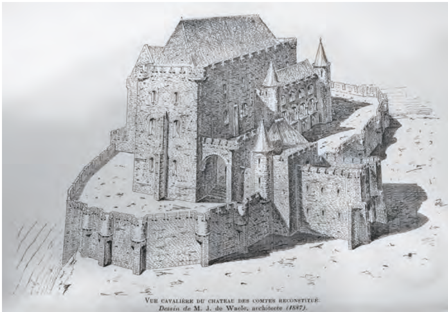
Afb. 4. Eerste visie op een gerestaureerd Gravensteen volgens ontwerp van architect De Waelo met medewerking van conservator Van Duyse (1887).