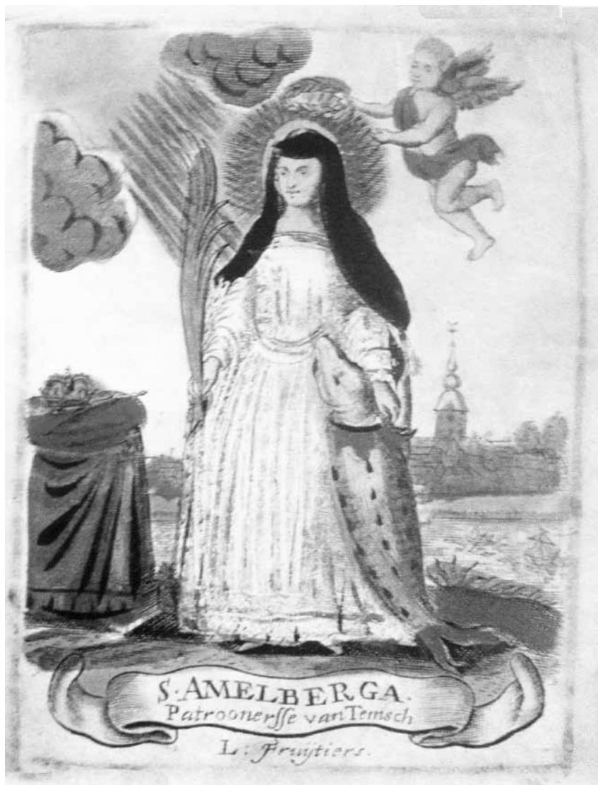
Afb. 2. Een heiligenprentje ('santje') uit de daarin gespecialiseerde Antwerpse ateliers Fruytiers (overgenomen uit Claes e.a., 2005): Amelberga met tegen haar aan vleiende steur, martelarenpalm en koninklijke attributen.

In een bijdrage over de Wijzemanstraat en omgeving verschenen in Ghendt-sche Tydinghen 2017 nr. 2, werd kort melding gemaakt van de Sint-Amelberga verering van de zusters-penitenten in een verdwenen klooster dicht bij de Sint-Jacobskerk (1). De Sint-Amelbergastraat ontleent er haar naam aan. Hoe kwam de cultus van die figuur daar terecht? We mogen aannemen dat dit gebeurde via de Sint-Pietersabdij, patroon (voogd) van het kloosterke (2).