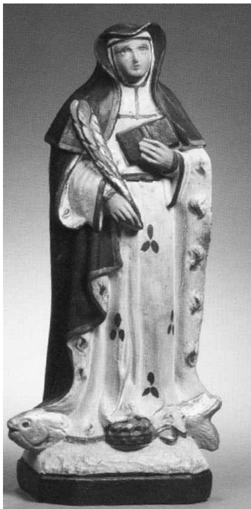
Afb. 1. Beeld van de heilige Amelberga voorgesteld als martelares en non in een wat ongewone positie: met de voeten op een grote vis (overgenomen uit Claes J. en A., 2009, Sanctus, Davidsfonds, Leuven).