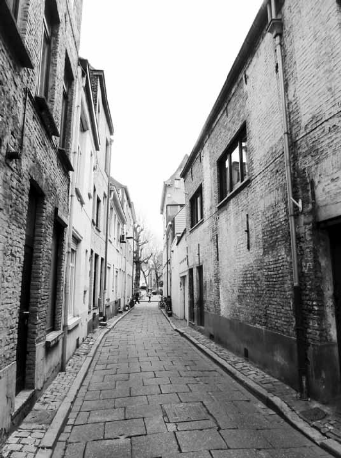
Afb. 5. De Sint-Amelbergastraat gezien vanuit de Baudelostraat (foto 2017).

ver ons bekend bleven er in de Gentse kerken geen relieken of afbeeldingen van Amelberga bewaard. Enkel de straatnaam bij Sint-Jacobs bleef bestaan ... maar dat is slechts schijnbaar. De naam was ook daar compleet vergeten. Het was de advocaat, verzamelaar-folklorist en dichter Jos Vermeulen die de heilige zo'n zeventig jaar geleden opviste en haar gebruikte om de vroegere Kleine Penitentenstraat te herbenoemen. Dat was eigenlijk een klein steegje (afb. 7) dat zijn oude penitentennaam niet mocht behouden.