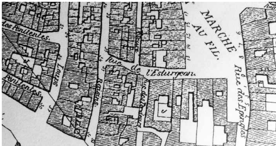
Afb. 6. Detail uit het stadsplan Gevaert en Van Impe (1870, kopie in DSMG). Rue de l'Esturgeon (Steurstraat) werd verbonden met de Grote Penitentenstraat doorheen het voor de aanleg van de Baudelostraat afgebroken bouwblok tussen de vroegere Druif- en Wolfstegen. Dit werd de huidige Penitentenstraat. Onderaan links een stukje van de actuele Sint-Amelbergastraat, toen de Kleine Penitentenstraat.

de Grote en de Kleine Steur aan de vroegere vismarkt, de huidige Groentemarkt (13). Bij de kaalslag en transformatie van de hele wijk ten noorden van de Vrijdagmarkt aan het begin van de vorige eeuw werd de huidige Penitentenstraat samengesteld uit de aanzienlijk verbrede Grote Penitentenstraat en dit Steurstraatje (afb. 8). Nu herinnert enkel een mooie steur op een dichtbij gelegen huisgevel in de Wolfstraat (afb. 9) daar nog aan.