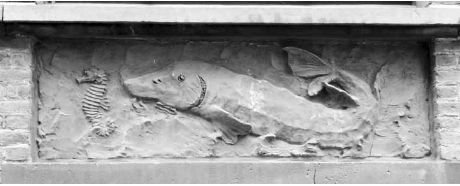
Afb. 7. Gevelsteen van het huis De Steur in de (nieuwe) Wolfstraat (foto 2015).

lets analoogs zien we onder Karel V toen een anonieme Frans schrijvende auteur, misschien iemand uit hofkringen - in hedendaagse termen: een embedded journalist - een beschrijving gaf van de excessen waarmee de Sint-Lievensprocessie in de jaren 1530 gepaard ging (16). Dit vormde de basis van wat alle latere auteurs over dat onderwerp ons wisten mee te delen. Daar tegen in gaan, dat proberen te disciplineren, zat trouwens in de geest van die tijd. Dat was niet enkel het geval bij de hervormers die protestanten zouden worden. Tijdens de contrareformatie zouden nog andere volkse semi-religieuze praktijken door de kerkelijke overheid tegengewerkt of verboden worden.