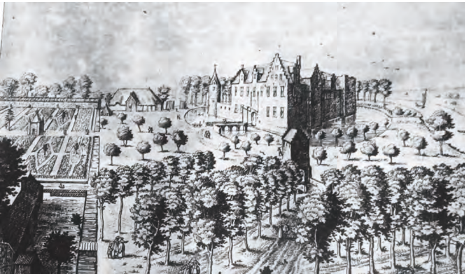
Afb. 3. Het kasteel de Blasere of Idewalle te Afsnee. Naast de geometrische tuin een hoevegebouw en meer centraal een vrijstaande duiventoren (1641).

Courtois-Gérard beschrijft in zijn boek Manuel pratique de jardinage (1849) de planten in een siertuin van een luthof: hagendoorn, witte acacia, Judea- of judasboom, Spaanse eik, rode kornoelje, heesters, zwepenboom, Europese netelboom, kerselaar, cipressen, zuurbes, smalbladige olijfwilg, gewone es, valse christusdoorn, hulst, beuk, taxus, seringen, boksdooorn, witte moerbeij, hazelnoot, iep, pruimelaar, grijze of grauwe els, perelaars, appelboom, wegedoorn, echte christusdoorn, gewone vlier, gewone liguster, levensboom en de wollige sneeuwbal. Dit zijn struiken en bomen die we in onze tuinen niet zo snel zullen terugvinden.