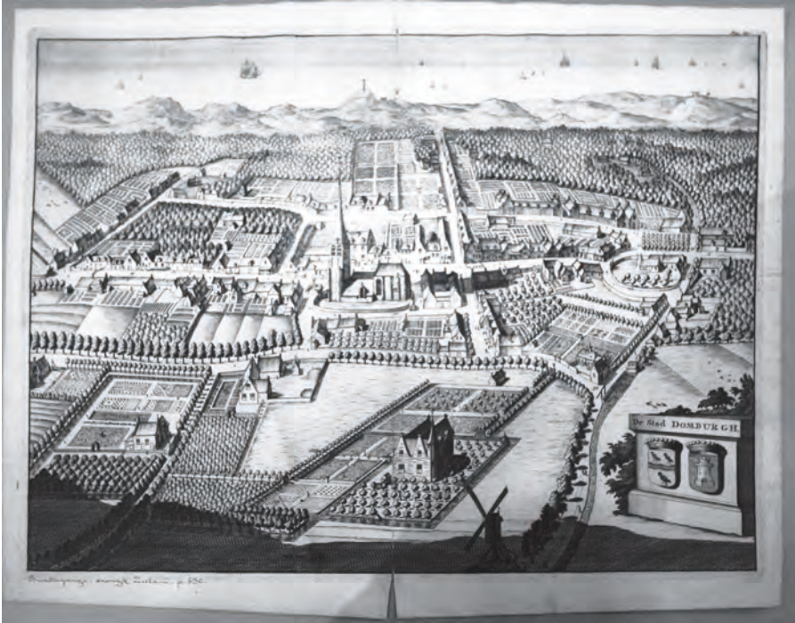
Afb. 1. Zicht op het Zeeuwse stadje Domburg met op de voorgrond drie lusthoven, klein en groot, met bijhorende strak geometrische tuinen en boomgaarden. In de achtergrond de duinengordel. (uit M. Smallegange, Nieuwe Cronijck van Zeeland, 1700).

tuurlijke tuinen.(6) Nu maken wij dit onderscheid nog steeds, maar spreken we van Engelse en Franse tuinen. Het kasteel van Versailles herbergt beide types tuinen. De tuin van dit kasteel is voor het overgrote deel natuurlijk Frans, maar het gedeelte rond het Petit Trianon is naar de Engelse stijl aangelegd. De sleutelwoorden bij Franse tuinen waren parterre en broderie . Hierop wordt verderop in de tekst dieper ingegaan. De kerngedachte bij de Engelse tuinen was het benaderen en het opnemen van de natuur in de aanleg. Geen wiskundige vormen dus.