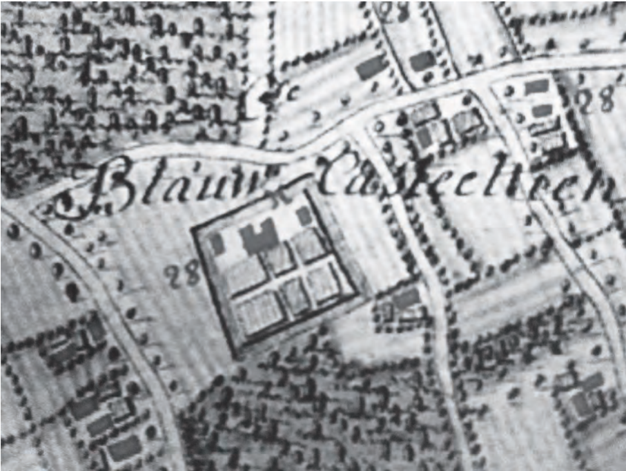
Afb. 2. Het Blauw Casteelken ( les Fougères ) in Melle, Varingstraat (detail uit de Ferrariskaart, 1771-1778).