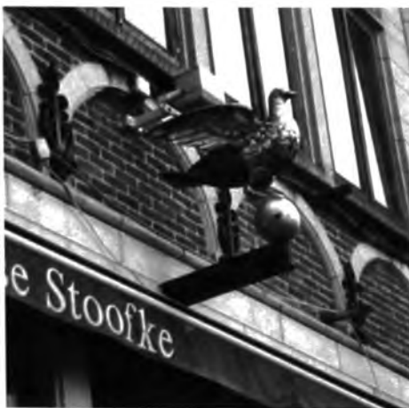
Afb. 1 De Gouden Duif (foto 2016)