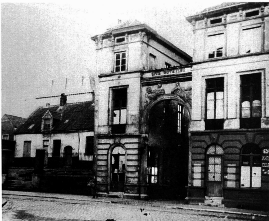
Afb. 5. Een minder gekende foto van de cité De Vreese met één van de twee monumentale poortingen ter hoogte van wat nu de straat Blandijnberg is.

13 huizen in het Berouw (1837) en Hooreman – Cambier hield het bij 15 in de Benedictijnenstraat (1858). Na het afschaffen van de stadstollen in 1860 werd een nieuwe ontwikkeling in gang gezet door industriëlen en grondeigenaars: de urbanisatie met het trekken van straten in voordien onbebouwde zones vooral buiten de stadsvesten. Zo ontstond het Congobeluik in de Limbastraat (104 huizen gebouwd door de vlasspinnerij La Liève in 1883), de Wissenha-gestraat (52 huizen gebouwd door het bedrijf Vercoutere, 1884 – 1885), de beluiken aan de Terneuzenlaan, de urbanisaties van de Rabotwijk, enz. Dat waren wel geen echte beluiken. De huizen stonden aan de openbare weg.