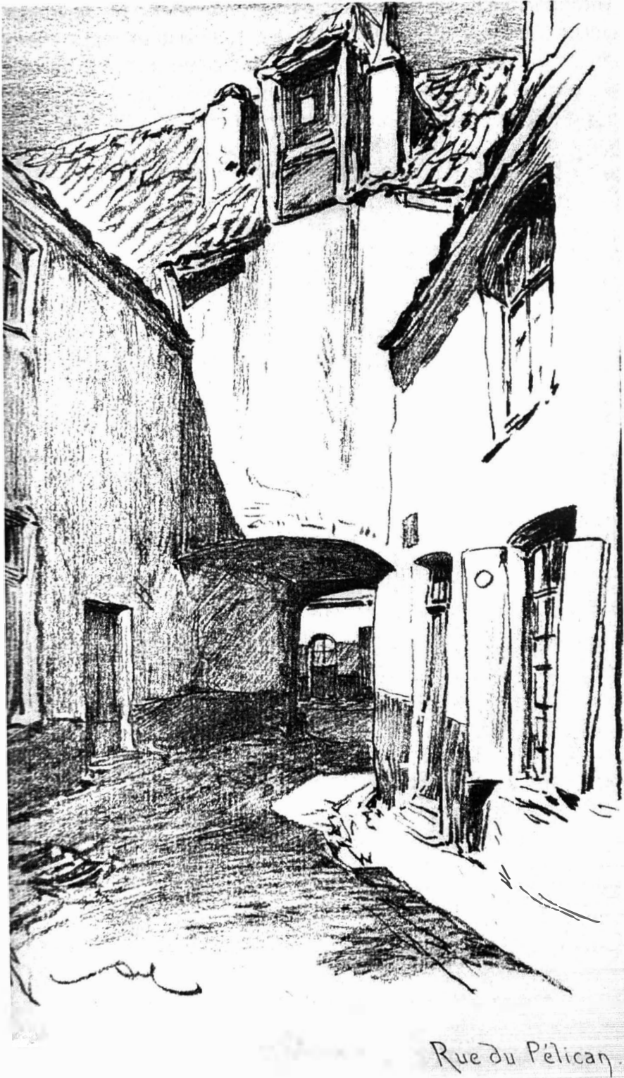
Afb. 3. De Pelikaanpoort: het belangrijkste beluik (1774 – 1778) van de Overscheldewijk, de grootste beluikenbuurt van de stad vanaf eind 18de - tot eind 19de eeuw. Ingang aan de huidige Belgradostraat (Tekening Armand Heins).