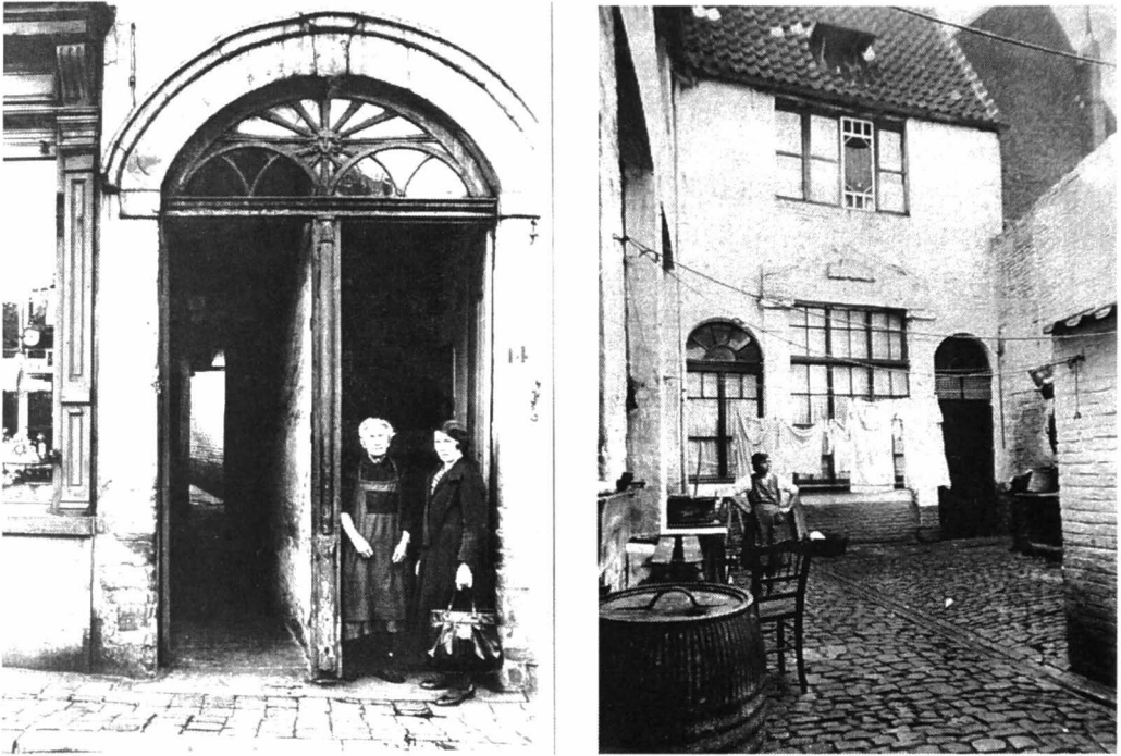
Afb. 7. Een poortingang kon worden opgedeeld in een privé-ingang tot het voorhuis (eventueel van de eigenaar) en een toegang tot het eigenlijke beluik. Hier aan de Reep (foto 1933, verzameling R. Moreau). Vermoedelijk was dit oorspronkelijk een enkele toegang tot wat een rijk huis moet zijn geweest, met doorgang tot de koer of tuin en een deur naar de eigenlijke woning opzij in een brede gang.

derde van de 18de eeuw hele reeksen kleine huisjes gebouwd uitkomend op de straat die volkomen vergelijkbaar waren met de min of meer afgesloten poortjes in dezelfde buurten in dezelfde tijd. In de sloppenwijken dus. En nog maar eens: het woord 'slop', verwant met 'sluipen', betekent nauwe doorgang, schuilhoek. Veiliger is het een objectief criterium te gebruiken. Ideaal daarvoor zijn de huistakken die gebaseerd waren op de geschatte huurwaarde van de huisjes.