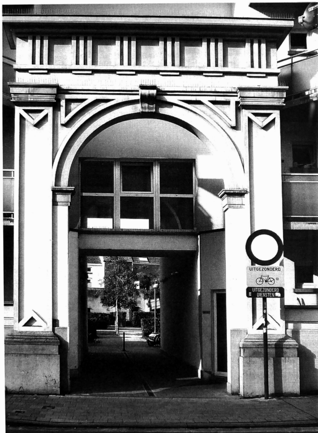
Afb. 4. Bewaard gebleven monumentale poortingang van de verdwenen Rietgrachtcit  aan de Kasteellaan gebouwd in 1862 -1867 (foto 2014).