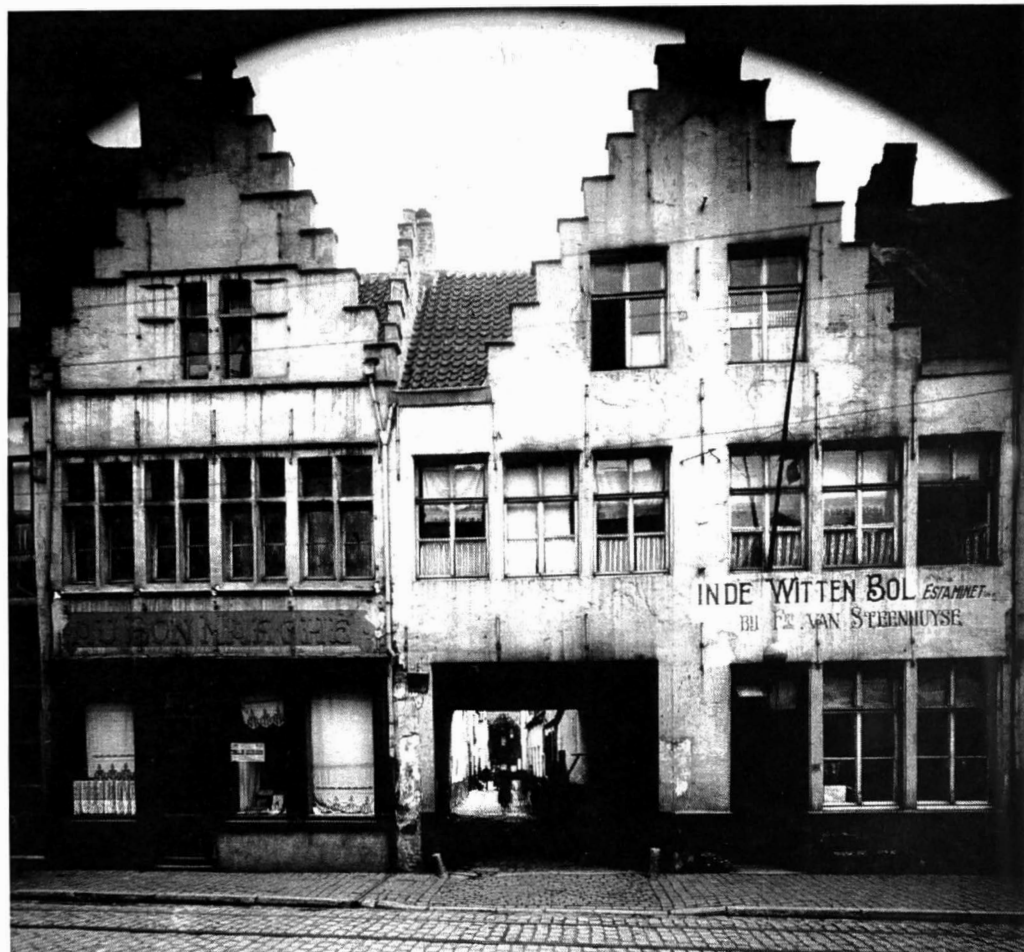
Afb. 8. Een brede toegang tot cité De Witten Bol in wat ooit een voor karren toegankelijke koer met stapelplaatsen of werkhuizen moet zijn geweest in de Sint-Salvatorstraat (foto 1933, verzameling R. Moreau).