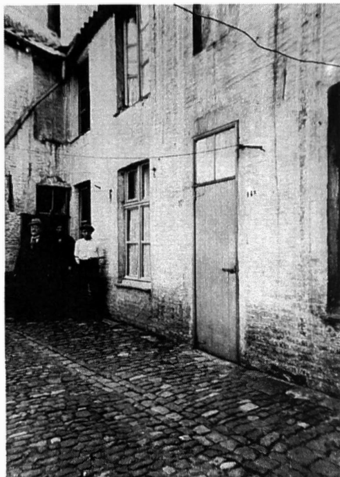
Afb.6. Een poortje kon ook een forse poort zijn en een zekere luxe vertonen, zoals hier aan de Reep. Vervallen glorie. Binnenin op de 'koer' zag het er wel anders uit. (foto 1933, verzameling R. Moreau).