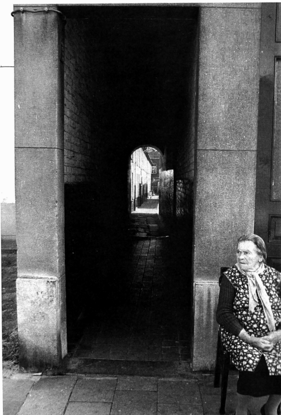
Afb. 1. De ingang van het Poortje van de Handborstel aan de Voetweg bij de Overpoortstraat, met bijhorend alleswetend meetje met bloemetjesshort. Of was het een meete, een kwaie commeere?