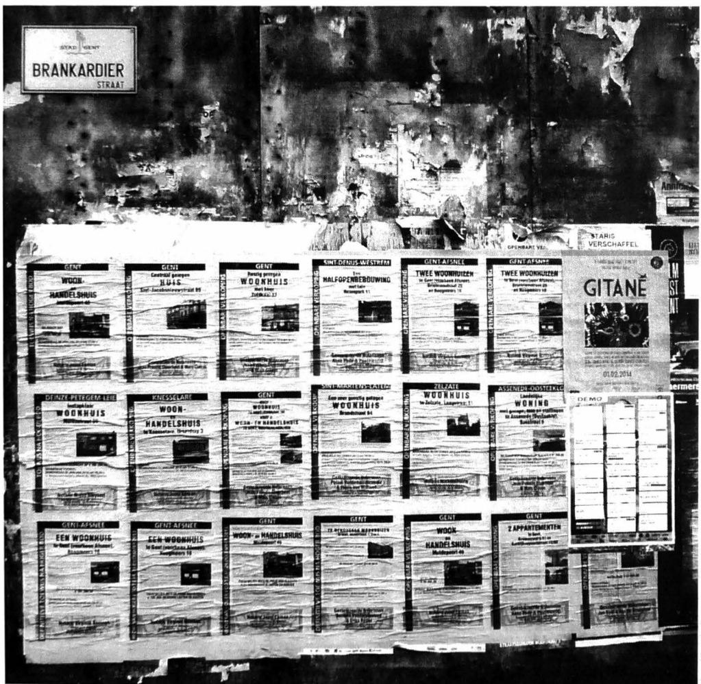
Afb. 1. Aanplakbiljetten in de Brankaardierstraat, Gent (2014).

De afbeeldingen hierbij tonen dergelijke kaartjes, alle gericht aan notaris Nève in de Gentse Burgstraat (rue de Bruges) en verstuurd in de periode 1924 -1929. De stadsaanplakker van Oostende bericht over het aanplakken van aankondigingen van een verkoop van bouwgronden in Koekelare. Ook Lokeren, Dendermonde en van vanzelfsprekend ook Brugge beschikten over een stadsaanplakker. In Sint-Niklaas betitelde de aanplakker zichzelf als schepenbode. In Kortrijk kon Victor Delbare zelfs met een heuse stempel zijn afzenderadres aangeven, met daarop prominent zijn functie: afficheur de la Ville . We mogen aannemen dat al deze heren, net zoals de schepenbode van Sint-Niklaas, verbonden waren met het stadsbestuur en ook nog andere taken hadden.