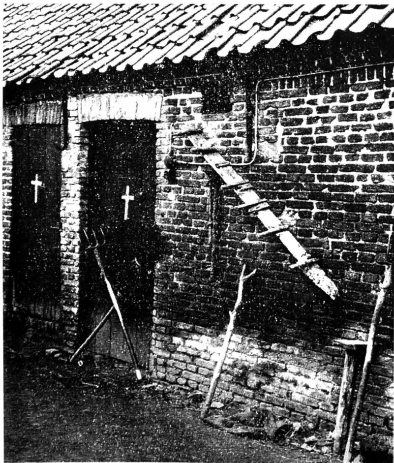
Afb. 3. Staldeuren met geschilderde kruisen bij een boerderijtje in de Brandemanstraat in Laarne naast Wetteren. Ook de gekruiste bezems waren bedoeld om hekserij af te weren.

Beschermende amuletten werden vervangen door medailles van heiligen. Pijn of ziekte werd overgedragen via kledingstukken of voorwerpen naar het heiligenbeeld of naar een boom, toegewijd aan een heilige. Dit was een toepassing van het sympathische principe.