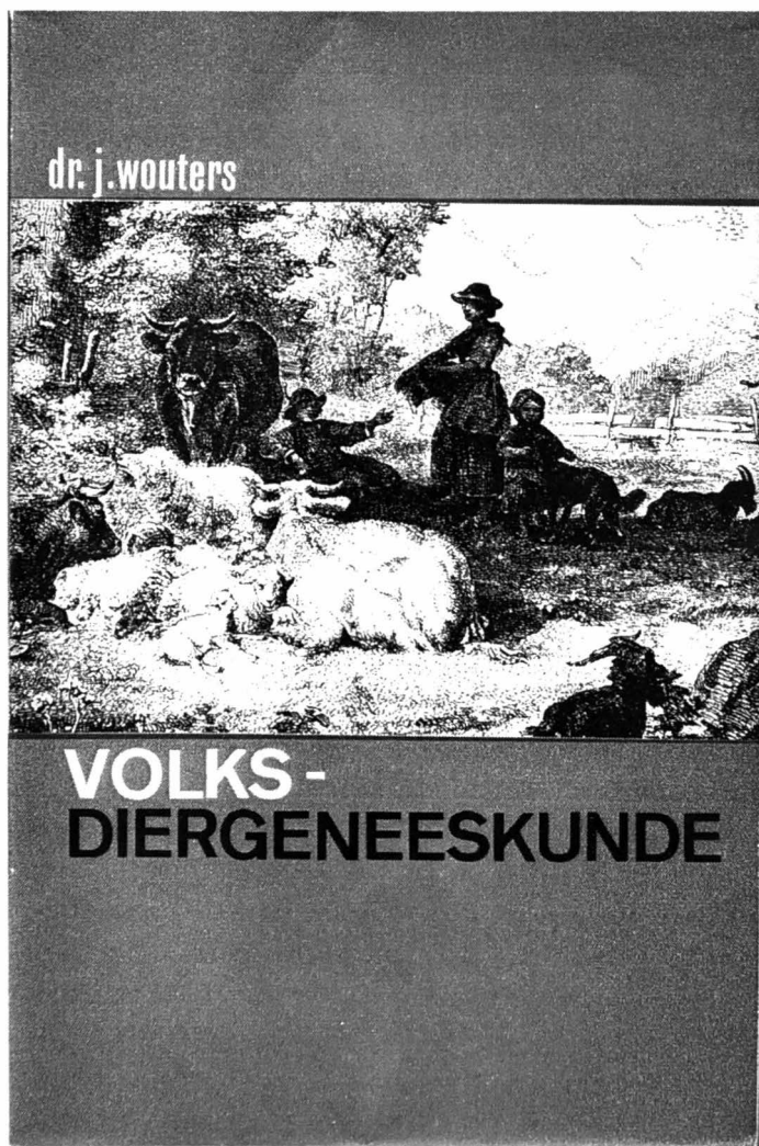
Afb. 1. 'Volksdiergeneeskunde' (1966).

verband met ziekte bij de volksmassa in zijn tijd (eind 19de eeuw) nog had. 'Thans, zoals voorheen schrijft de menigte nog aan onze kwalen vier voorname oorzaken toe: Gods toorn, een boze geest in 't lichaam, de kwade hand en de wormen' (over die 'wormen' verder meer). In deze bijdrage willen we vooral aandacht schenken aan het geloof in hogere machten in verband met dieren en hun ziekten aan de hand van voorbeelden daarvan door Wouters genoteerd. Enkele bijkomende gegevens zijn afkomstig uit het familiearchief van de Waregemse dierenartsenfamilie Bouckaert.