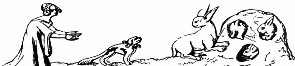
Afb. 1. Konijnenjacht in een warande met pijl en boog, knuppel en jachthond door een adellijk uitzierende dame. Reproductie van een Franse miniatuur uit 1393, overgenomen uit Zeunzer, 1963, p. 412.