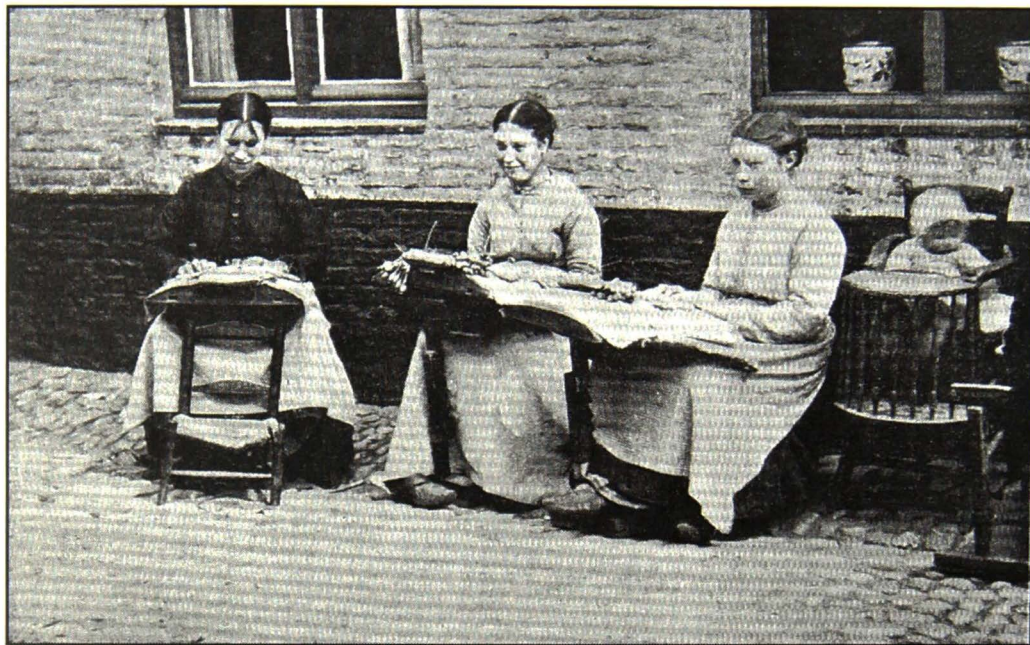
Afb. 8. Tielt omstreeks 1900. Uit: Verhaegen (1902), p. 215.