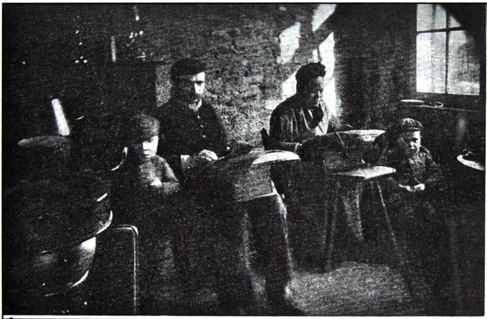
Afb. 6. Kantwerker ergens in Vlaanderen. Uit: De Winne (1903) 'Lichtteekening' van M. Lefébure, Gent, p. 185.

We laten foto's uit die tijd de sfeer evoceren (Afb. 6, 7 en 8). De tekst van een simpel kantwerkersliedje uit de periode rond 1850 laat niets aan de verbeelding over (Afb. 9).