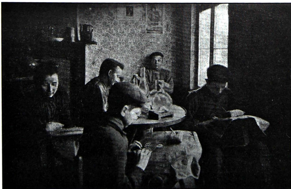
Afb. 7. Ergens in Vlaanderen rond 1900. Uit: De Winne (1903) 'Lichtteekening' van M. Lefébure, Gent, p. 201.