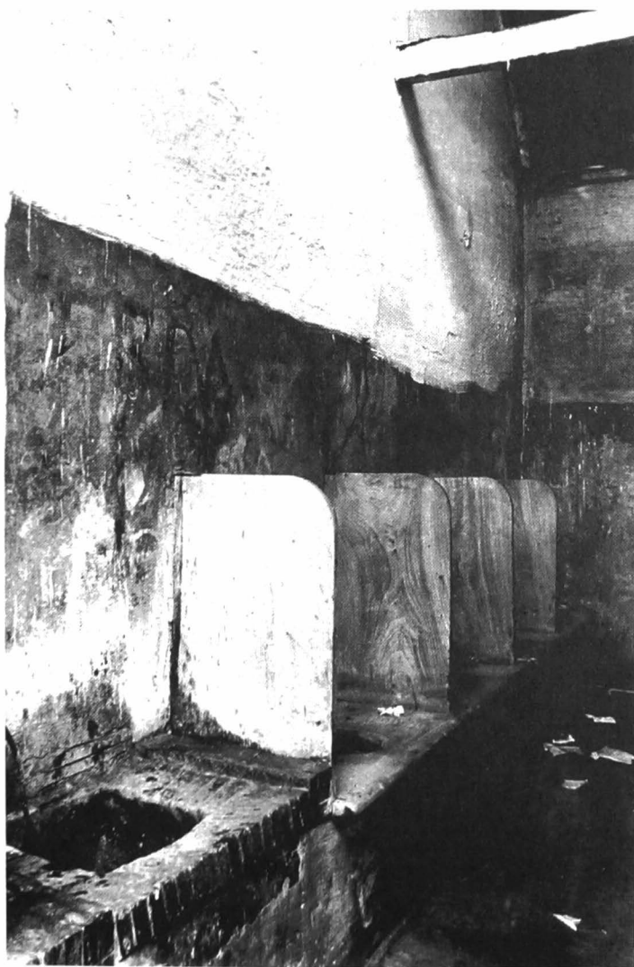
Afb. 3. Net iets beter dan aan de Minnemeers in de jaren 1470: toiletten van de cité Vera Paz in het Sasseblindeken tussen de Voormuide en de Sassekaai in 1933.

en dammen (dijken) waar je in of achter enigszins kon schuilen. 15 En verder waren er natuurlijk nog de vele steegjes en 'steeghers' (watertrappen) her en der in de stad. De professionele mestrappers haalden niet enkel paardenvijgen op, mogen we aannemen. 16 De huidige Gentse Stadhuissteeg heette vroeger Pitsteeg omdat ze leidde naar Te Putte (oudste woordvorm Te Pitte) en vanzelfsprekend werd dat de Pissteeg in het gewone taalgebruik. 17 Tot voor enkele decennia was het Hazewindsteegje tussen de Graslei en de Korenmarkt berucht op dat gebied. Andere steegjes die voor dergelijk gebruik uiterst geschikt waren, werden al decennialang afgesloten, maar bij die steeg was dat enkel tijdens de Gentse Feesten het geval. Wanneer het de spuigaten dreigde uit te lopen, inderdaad.