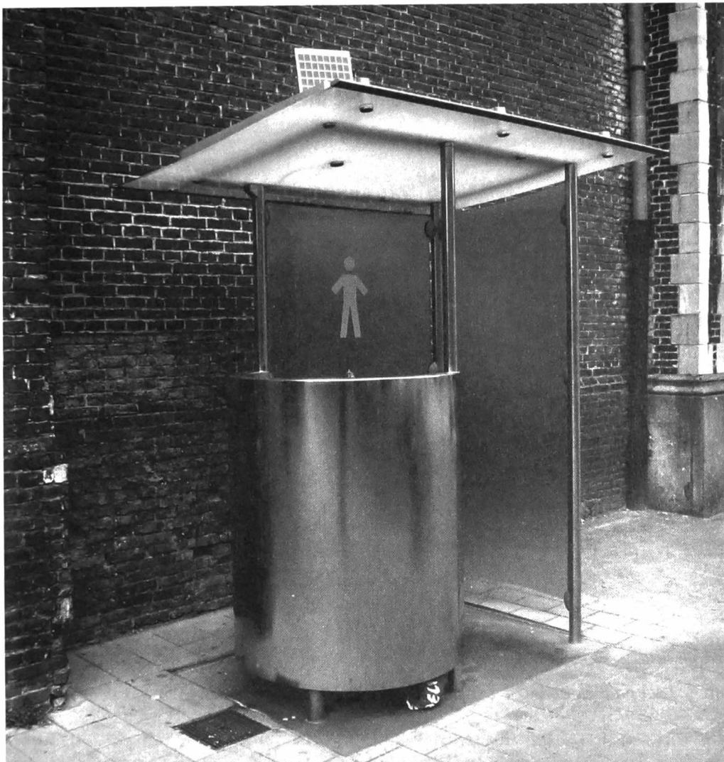
Afb. 4. Drongensesteenweg (foto 2014). Modern urinoir aan de Sint-Jan-Baptistkerk. In de kerkmuur zijn nog de sporen te zien van de oude weggebroken pisbakken. Die werden wel meer tegen kerkmuren geplaatst. Blijkbaar hadden (mannelijke) kerkgangers daar nood aan. Bemerkt het zonnepaneeltje bovenaan.

En opnieuw waren de Gentse Feesten daar. In 2011 daagde Baharak Bashar de Stad voor de rechter omdat er 200 gratis mannentoiletten waren tegen slechts 16 voor vrouwen (afb. 6) 24 . Aan zin voor initiatief en inventiviteit ontbrak het niet. Er was de 'wereldtoilettag' (in samenwerking met de vereniging Urobelt die de belangen van mensen met urologische problemen behandelt) en slogans zoals 'Leg mijn blaas het zwijgen niet op!' en 'Laat haar zitten'.