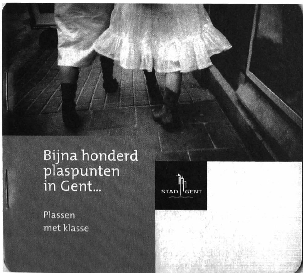
Afb. 2. Stedelijke mini – brochure 'Plassen met klasse' (ongedateerd, vermoedelijk 1985).

De titel van het foldertje was ook de naam van het project waarmee de Stad Gent in 2004 de prijs van een wedstrijd 'Thuis in de stad' van de Vlaamse overheid won 20 . Die geldprijs zou meteen geïnvesteerd worden in nieuwe installaties. Een opsteker, al vertegenwoordigde het bedrag slechts ongeveer een tiende van wat de Stad in die tijd aan publiek sanitair uitgaf. Er kwamen nieuwe fris ogende constructies uit inox, aluminium, kunststof en glas in opvallende locaties met zonnepaneeltje, efficiënte geurafsnijding en goed onderhoud (afb. 4).