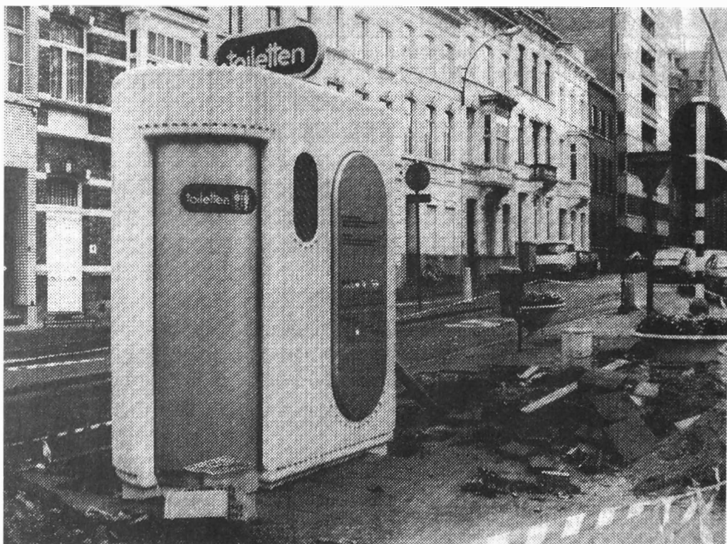
Afb. 1. Afsluitbaar toilet aan de Heuvelpoort. Krantenfoto en bericht uit 1986 (De Gentenaar – Het Nieuwsblad).

Ik heb trouwens toen ook de vrouwenbeweging tegen mij gehad. Omdat de Pistron enkel voor mannen was. Wij hebben ons toen verkleed als toreador en hielden een rood doek voor de vrouwen die zich installeerden. Toen ze neer gingen zitten, riepen we dan natuurlijk Olé! en trokken het doek weg. Dat heeft dus niet lang geduurd.