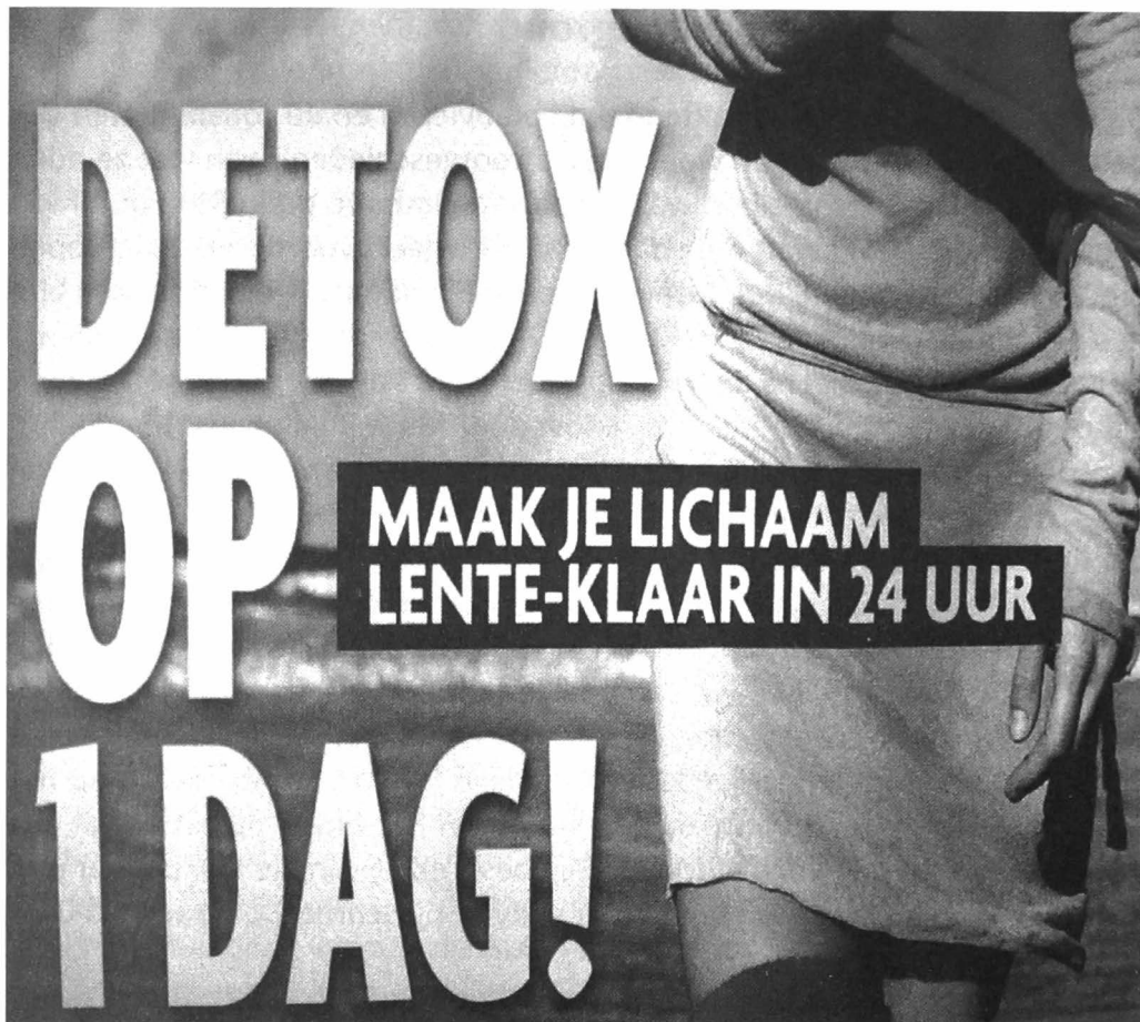
Afb. 2. Uit een publicitairblaadje bij de bakker (Gent, 2010).