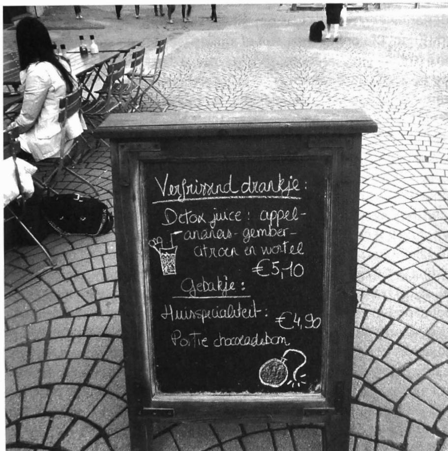
Afb. 1. Gent, 2014, terrasje Kalandeberg.

voorbeeld in de vooral bij onze oosterburen populaire kuuroorden met een eeuwenoude traditie. Van dergelijke faciliteiten kan je nu ook in wellnesscentra in al onze steden en zowat overal op het Vlaamse platteland genieten. De markt biedt aan elk wat wils.