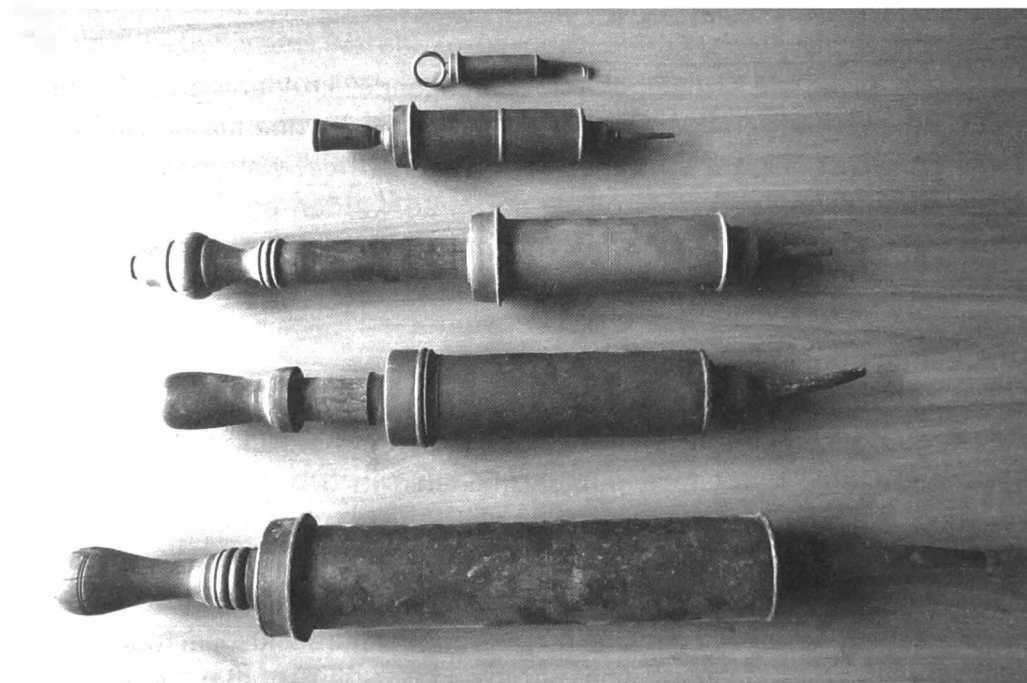
Afb. 6. Clysteerspuiten uit de collectie van het Museum Diergeneeskundig Verleden Merelbeke (schenking Omer Van Den Abbeele). De grootste spuit meet ca. 50 cm, de kleinste ongeveer 7 cm.

een eeuwen overspannende periode elkaar op in hun bezetenheid door obstipatie. Armen hadden daar schijnbaar minder last van, al kunnen we dat eigenlijk niet weten. Zij kwamen nooit voor het voetlicht. Dat rijkeluisprobleem vond uiteraard zijn weerslag in de geneeskunde. Vooral na de introductie in de 16 de eeuw van de klisterspuit, voorloper van de injectiespuit (seringue), werd het klisteren populair. Gerrit Komrij haalt in het hoofdstuk 'Klisteren & Purgeren' van zijn min of meer beruchte 'Kakafonie' de ongelukkige Franse koning Louis XIII aan die in één jaar tijd 215 purgaties en 212 klyasma's mocht ondergaan (Komrij, 2006). Het kon niet anders of zo'n koninklijk voorbeeld kreeg navolging. Meer zelfs: het klyasma evolueerde van modeverschijnsel tot noodzaak. Onder Louis XIV, die er zelf zo'n 2000 onderging, kende het klyasma een sindsdien nooit meer geëvenaarde populariteit. De bijtende satires van Molière, die het doen en laten van dokters en apothekers op de korrel namen, konden daar geen afbreuk aan doen.