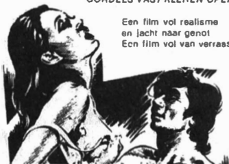
Afb. 4 en 5. Programmaboekjes.

Een film vol realisme en jacht naar genot Een film vol van verrassingen