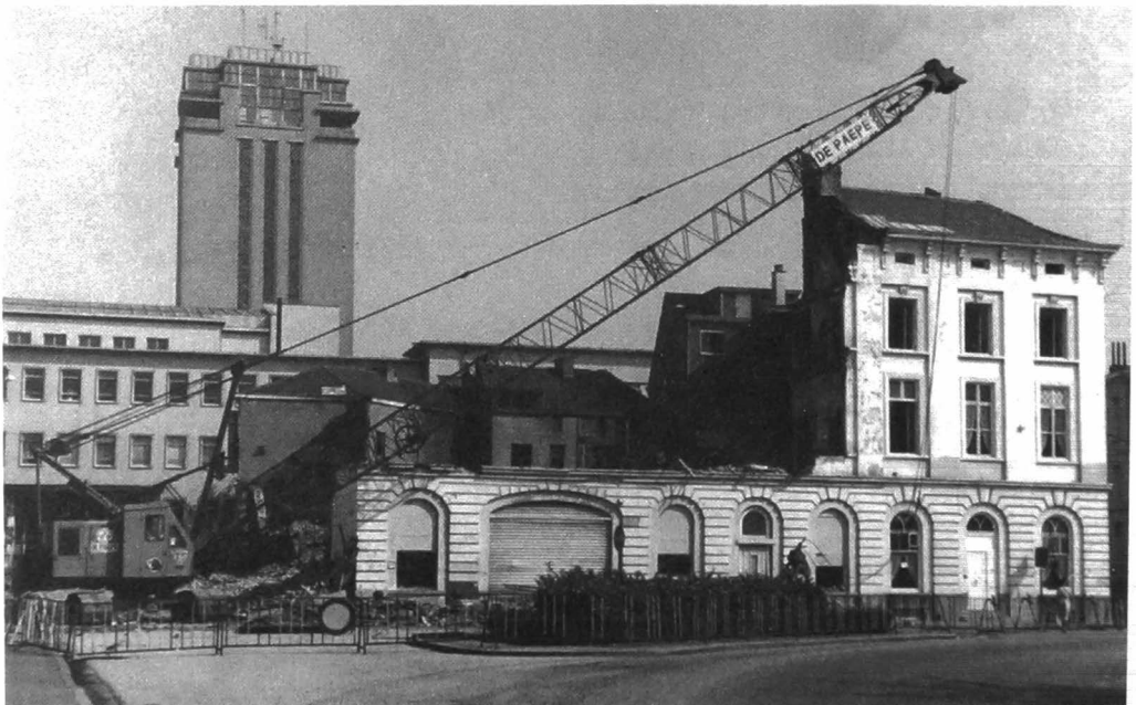
Afb. 6. Afbraak van het bioscoopcomplex (verz. M. Vollaert).

Een tweetal kleinere zalen met een aan de Leopold vergelijkbaar, maar steeds harder wordend aanbod (Paris, ABC), waren er in jaren 60 bijgekomen. Zij hielden het langer uit. Maar ook zij verdwenen of werden omgevormd tot etablissementen voor peep shows met live voorstellingen naast projecties (afb. 7).