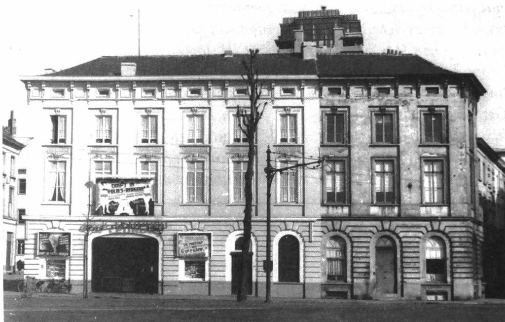
Afb. 1. Bioscoopcomplex Leopold III op Sint-Pietersplein, Gent, voor de afbraak.

De verkoop was streng verboden. In het straatbeeld ontbraken dergelijke afbeeldingen helemaal, al werden in de loop van de 20 ste eeuw wel hier en daar min of meer blote standbeelden opgericht, maar dat was ‘kunst’, niet ‘echt’, en uiteindelijk bleef het allemaal erg zedig. In de spektakelzalen aan het Zuid waren in het Interbellum wel eens blote armen en benen of zelfs halzen(!) te zien op de scene, uiterst zelden meer. Dat alles veranderde nogal brutaal door de komst van de film. Voorstellingen van naakt in een erotische of zelfs pornografische context konden gemakkelijk en voor weinig geld bij een breed publiek aan de man (de man, inderdaad) gebracht worden. In Gent gebeurde dat in de cinema Leopold III aan het Sint-Pietersplein vanaf jaren 30 van de vorige eeuw. Hierna geven we een kort overzicht van de geschiedenis van deze iconische instelling. Maar vooraf bekijken we reacties die de Leopold in de beginjaren opriep. Daarover zijn we uitstekend ingelicht en dat nog wel via een gebeuren in een bij uitstek publiek forum.