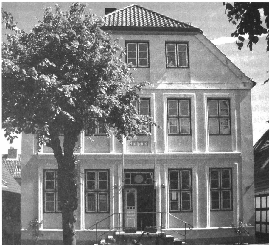
Afb. 10: Het statige Rathaus van de stad Arnis.