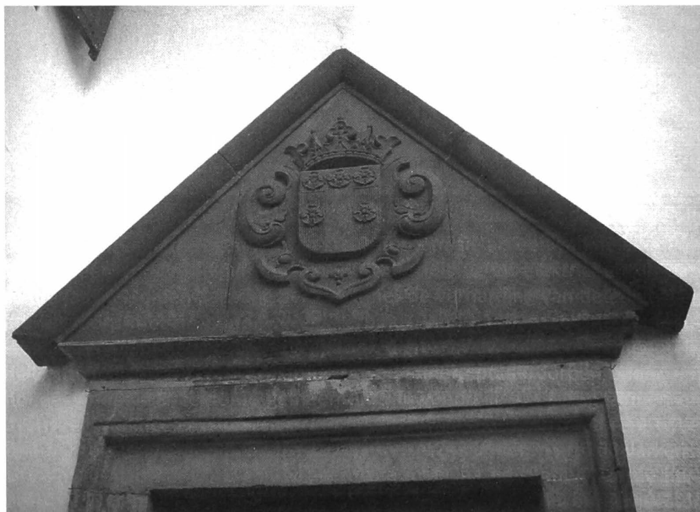
Afb. 9: In het fronton boven de deur van de historische trappentoren in het kasteel prijkt het wapenschild van de gemeente Dierfeld, in Eifelsteen gebeiteld.

Dierfeld ontstond in de 16 de eeuw als jachtslot van de graaf van Manderscheid. Het huidige woonhuis, een kasteel met een karakteristieke achthoekige trappentoren, dateert uit die periode. De bijgebouwen zijn uit de 18 de en 19 de eeuw. Rond 1700 werd vooraan nabij de ingangspoort een kleine kapel met torentje tegen het hoofdgebouw aangebouwd. Via de rentmeesters van het jachtslot, werd het landgoed in 1909 eigendom van de familie von Greve-Dierfeld. In juni 1914 werden op het domein resten van een Romeinse villa opgegraven. Dierfeld heeft geen afzonderlijk gemeentehuis, maar enkel een bureau waar de gemeentelijke stukken netjes apart bewaard worden. De stembus die men in Dierfeld gebruikt voor de burgemeestersverkiezingen, heeft er al 60 jaar trouwe dienst opzitten.