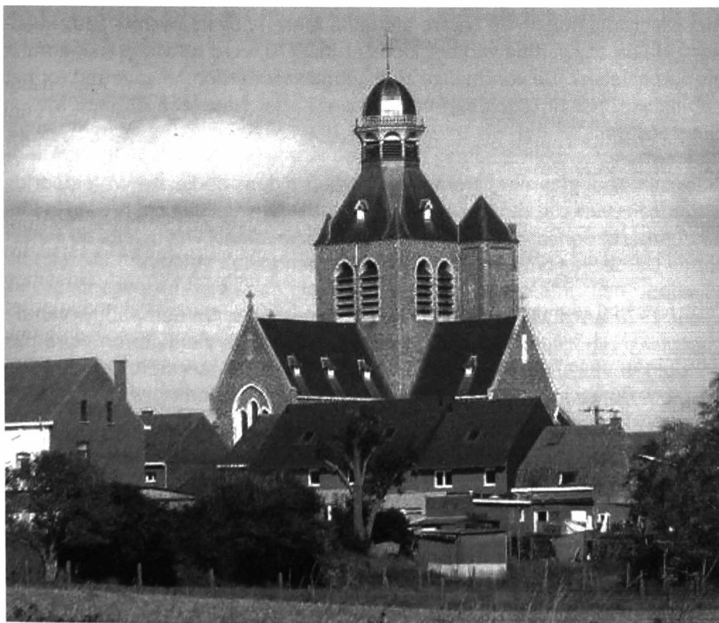
Afb. 5: De stad Mesen met haar karakteristieke kerktoren

Het stadje Durbuy ligt in het smalle kloofdalen van de Ourthe. Daardoor komt het dat het een kleine, gedrongen stadskern heeft van nauwelijks 200 meter diameter met nauwe kronkelige straatjes. Vanuit dat oogpunt heeft men in Wallonië aan Durbuy de titel "kleinste stad van België" gegeven, wat leidde tot een geweldige boost van het toerisme. Toch is die titel in werkelijkheid onzeker: de meeste bronnen vermelden dat Durbuy voor 1976 slechts 350 à 400 inwoners had, maar men doelt daarmee op de stadskern. De atlanten van de Belgische gemeenten uit de periode 1835 – 1845 vermelden echter dat het grondgebied van de gemeente Durbuy binnen zijn toenmalige grenzen 1250 inwoners telde!