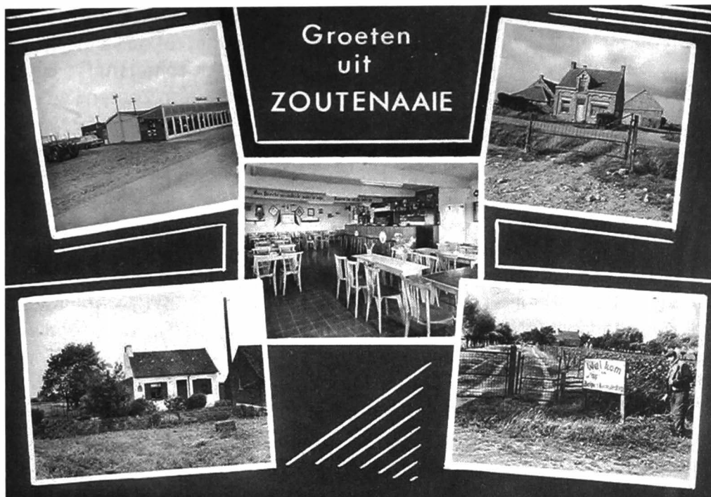
Afb. 2: Toeristische ansichtkaart van Zoutenaai uit de jaren 1960