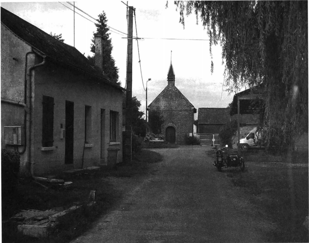
Afb. 6: Het centrum van Epécamps geeft een ietwat rommelige indruk.

een kerkje en een eigen pastoor. In 1901 waren er 32 inwoners, het kerkje was nog in gebruik en er was zowaar een eigen dorpschooltje met één lerares.