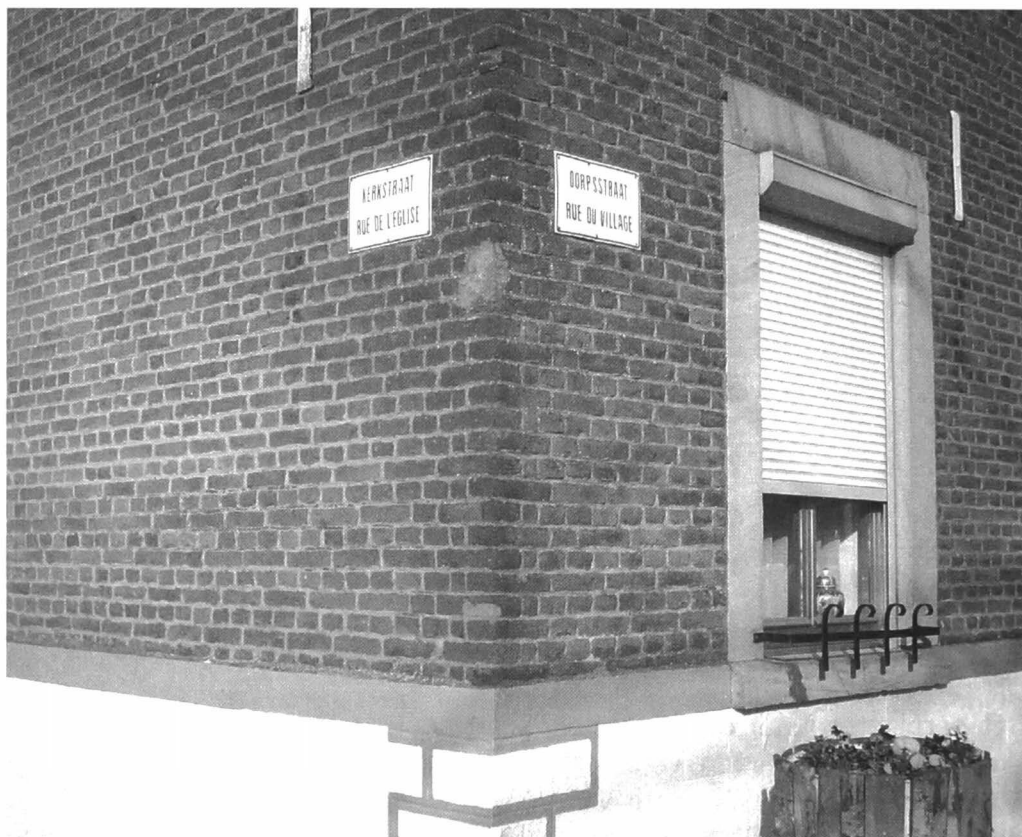
Afb. 4: Tweetalige straatnaamborden te Herstappe

tijd welgeteld twee auto's en twee tractoren tegen. Enkele mensen van ter plaatse namen rustig de tijd om met ons een praatje te slaan. Allen drukten ons op het hart dat ze het leven in een minidorp als Herstappe voor geen goud van de wereld wilden missen.