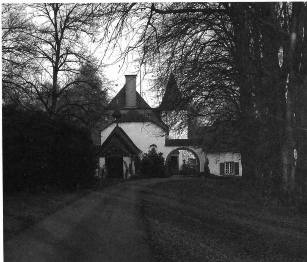
Afb. 8: Dierfeld, een landgoed met kasteel en een zelfstandige gemeente

Op de statistische derde plaats per 31.12.2011 vinden we de gemeente Dierfeld, nabij Manderscheid in de streek van Wittlich in Rheinland-Pfalz met 10 inwoners (7 mannen en 3 vrouwen) op een oppervlakte van 154 ha. Dat deze gegevens kloppen, weten we dankzij een online gepubliceerd statistisch overzicht van de Verbandsgemeinde Manderscheid per 31.1.2013.