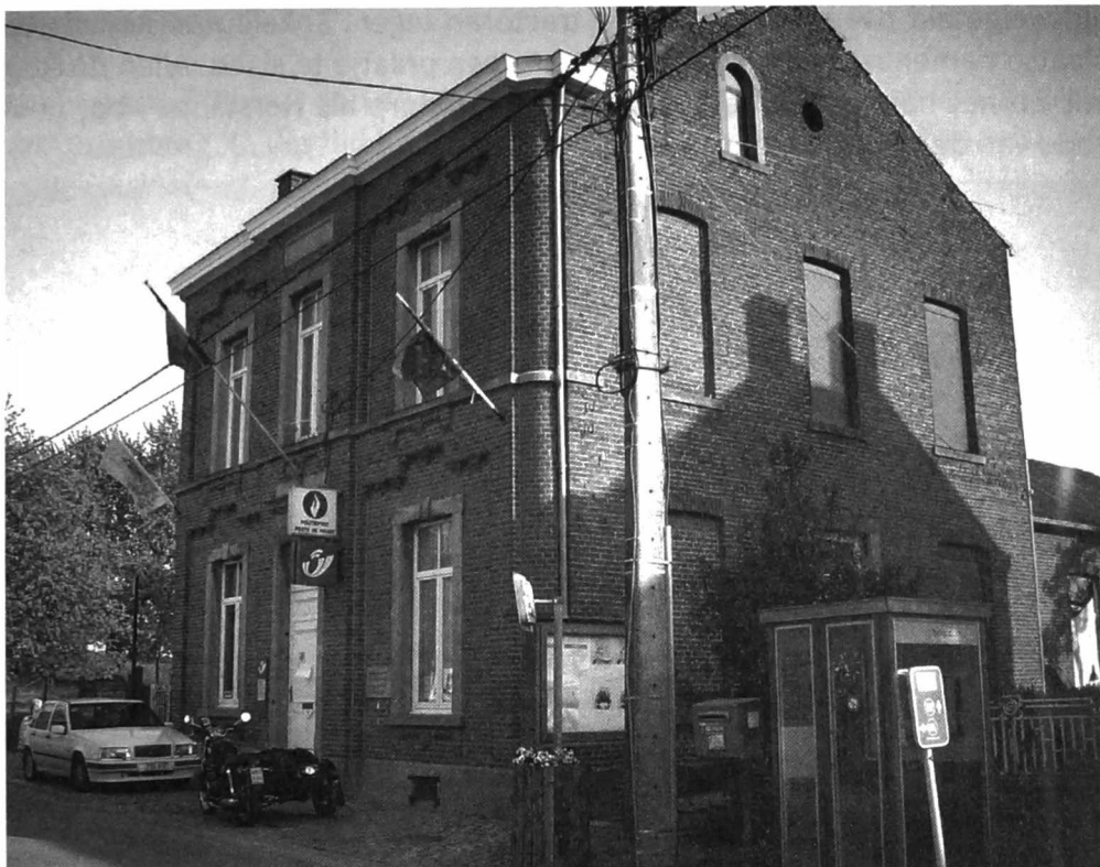
Afb. 3: Het gemeentehuis van Herstappe, anno 2011 nog met een echte telefoonsel