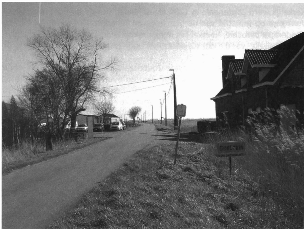
Afb. 1: Het centrum van Zoutenaaië

Tijdens de Eerste Wereldoorlog lag Zoutenaaië op een veilige afstand achter het front. Niemand van de ingezetenen sneuvelde en niets werd er vernietigd. Na de oorlog werden er een paar noodbarakken opgetrokken voor de huisvesting van ontheemde bewoners uit de dorpen van de frontstreek, zodat het inwoneraantal van de gemeente in 1920 steeg naar een historisch maximum van 37.