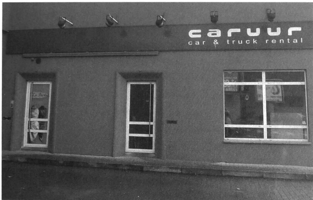
Afb. 2: 'steekkarren' anno 2013 ofte Car Rental