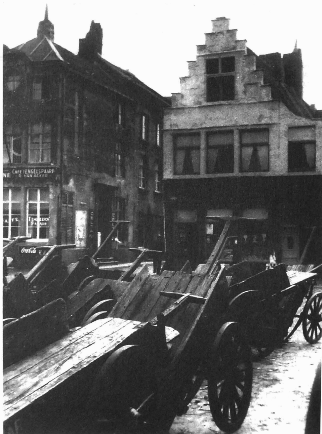
Afb. 1: Steekkarren (collectie DSMG Begijnhof Sint-Amansberg, ongedateerd)