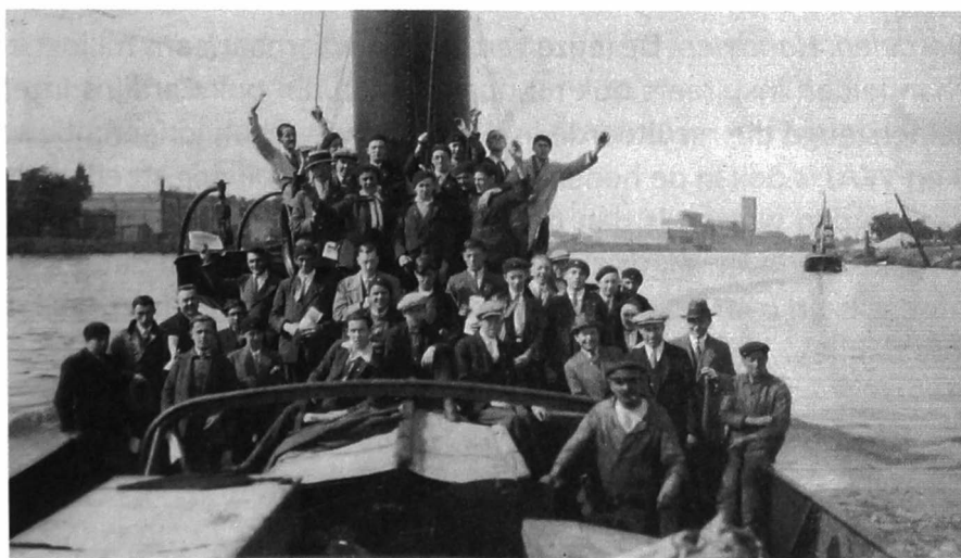
Afb. 4. Boottocht, haven van Gent

Niet alleen de arbeidersjongeren die werk hadden konden rekenen op de KAJ en VKAJ, er werden ook acties op poten gezet om de jonge werklozen een hart onder de riem te steken. Bijgevoegde afbeelding toont hier een voorbeeld van, een boottocht met jonge werklozen langs de haven van Gent.