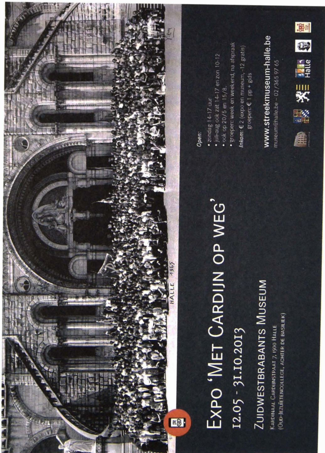
Afb. 5. Poster van de expo 'Met Cardijn op weg' 12.05 - 31.10.2013 Zuidwestbrabants Museum, Halle www.streekmuseum-halle.be