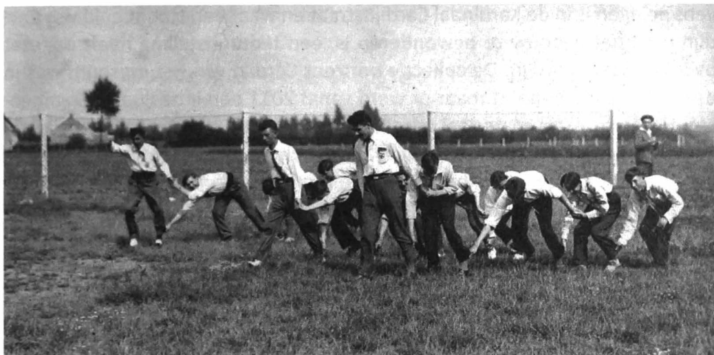
Afb. 3. Kreeftenkoers

Niet alleen de arbeidersjongeren die werk hadden konden rekenen op de KAJ en VKAJ, er werden ook acties op poten gezet om de jonge werklozen een hart onder de riem te steken. Bijgevoegde afbeelding toont hier een voorbeeld van, een boottocht met jonge werklozen langs de haven van Gent.