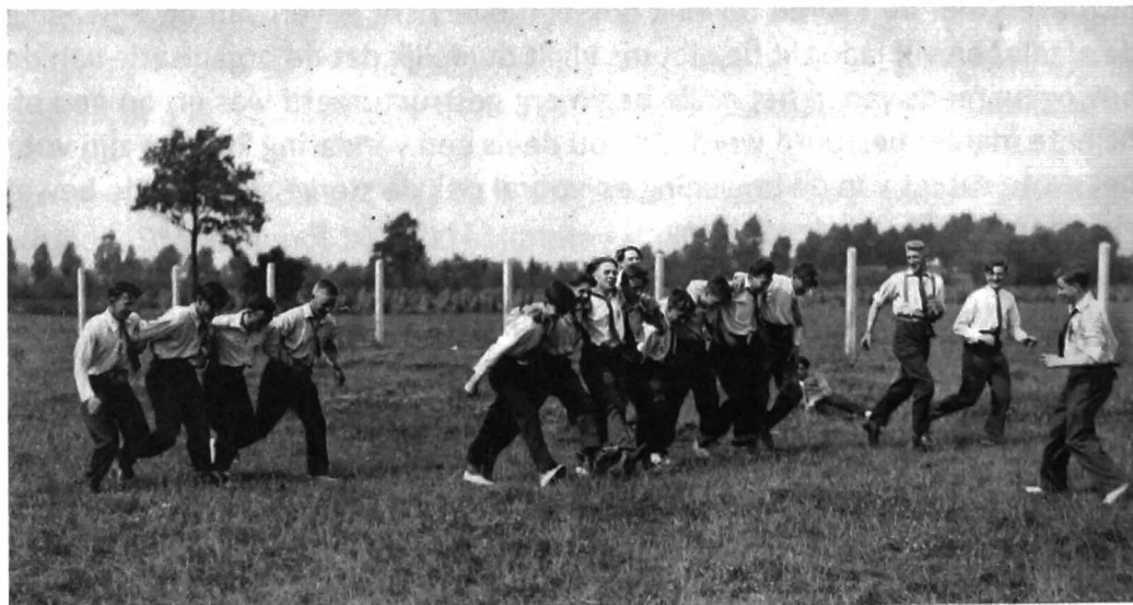
Afb. 2. Gebonden duizendpoot

Een uitstekend voorbeeld hiervan zijn de verscheidene ontspanningsactiviteiten die door de KAJ georganiseerd werden want ook in de jaren '30 deed de KAJ al veel meer dan het organiseren van optochten en studiedagen en het samen bidden. De spelletjes die toen gespeeld werden doen sterk denken aan de hedendaagse jeugdbewegingsspelletjes zoals kruiwagen, Dikke Berta, Chinese voetbal en vele andere. Met klinkende namen als 'Gebonden duizendpoot' en 'Kreeftenkoers' lijkt het plezier verzekerd, zoals de bijgevoegde afbeeldingen ook tonen.