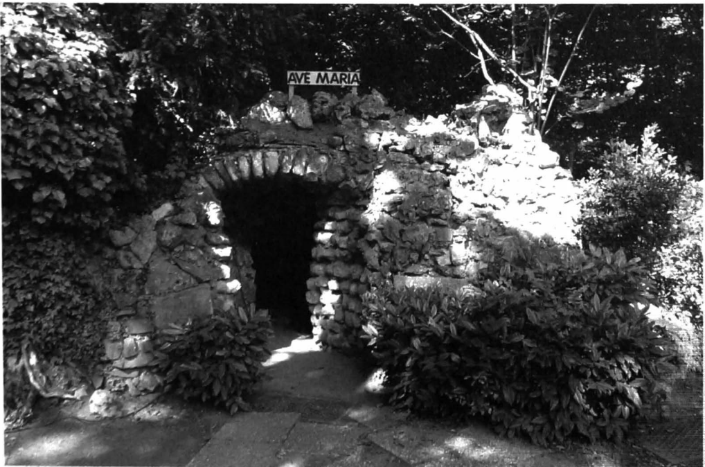
Afb. 2. Buitenzicht van de grot, anno 2012.