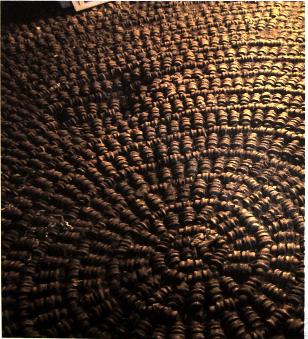
Afb. 4. Gedeelte van de vloer binnenin de grot.

'In het bos van deze villa (de Meulemeester) was er een slingerend tuinpad van circa 300 voet (100 meter) lang, overdekt met haagbeuk die langs een gewelfd latwerk werd geleid. Dit pad leidde naar een kunstmatige grot die op fantastische wijze geplaveid was met middenvoetbeentjes van schapen ( fantastically paved with metatarsal bones of sheep ). Daarna bereikten we het zogenaamde theater van Pan. Dit 'theater' werd volledig gevormd met haagbeuken en struiken die door snoeien de vorm van een podium hadden en volledig uitgerust waren met scènes langs zij, vooraan en opzij boxen en een parterre. Na een bezoek aan dit extravagante hoogtepunt van tuinbouw in de Lage Landen, keerden we terug naar het huis langs een laan afgezet met Oosterse platanen, de mooiste die we ooit zagen' 7 .