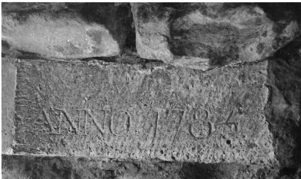
Afb. 1. Steen met jaartal 1785 ingewerkt in de oksel van de grotingang.

Onze Lourdesgrottenbestand is minstens gedeeltelijk gebaseerd op die traditie (en bouwtechniek!). Ook deze constructies werden in parken en hovingen gerealiseerd ter verpozing, maar dan wel bij voorkeur in een heel erg 19 de -eeuwse devote gedaante.