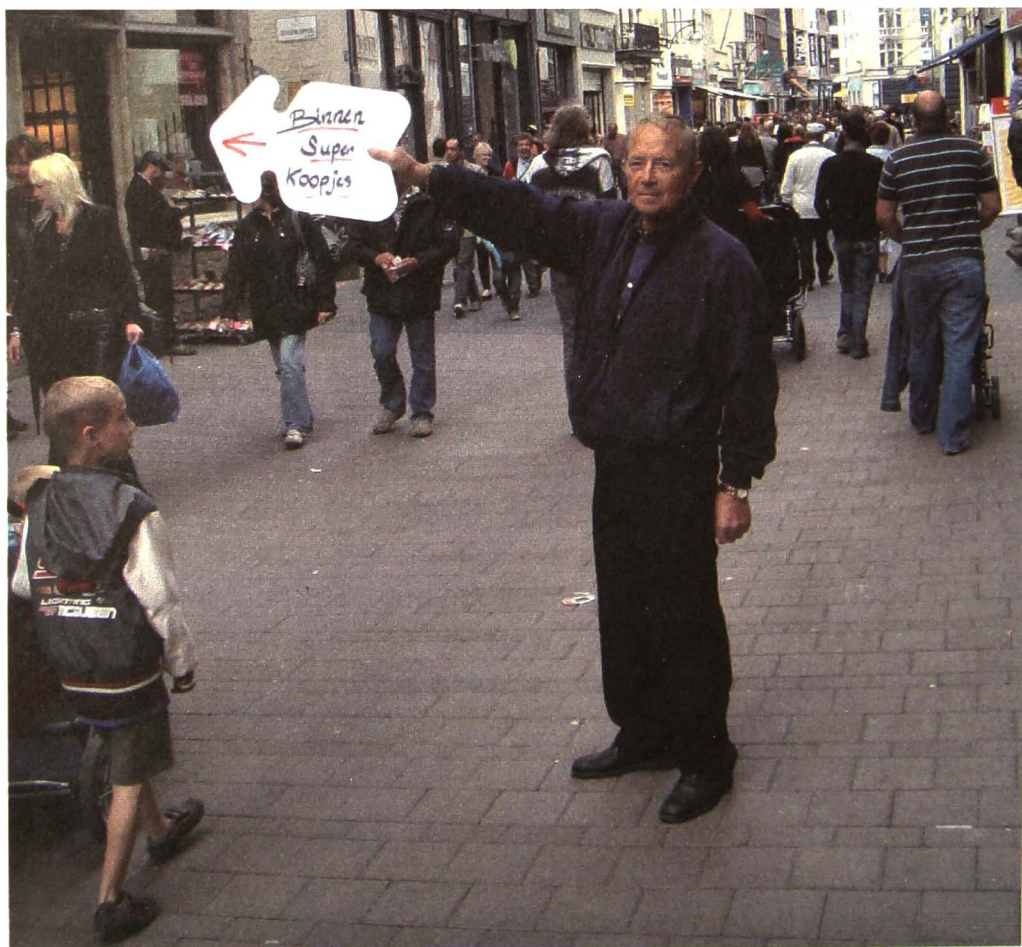
Afb. 3. Discrete (geluidloze) binnenlokker aan het werk voor een schoenenwinkel in de Langemunt tijdens de Gentse Feesten 2011.

Supplieerende verthoonen ... meestercleervercoopers dat het aen u ed(elen) bekend is van de groote ongheregheltheden ende importuniteyten die der daeghelycke ende naemenlyck op mertdaeghen ende h(eilighe) daeghen worden ghecommetteert by een groot deel van de supposten van de neerynghe van de voorseyde meestercleervercoopers, als door hunne domestiquen ende andere geemployeerde by middel van lantslieden ende andere persoonen commende omtrent hunne huysen ofte aldaer passerende aen te locken, deselve passerende persoonen soo daenigh by hunne cleederen vaste te nemen ende trecken in hunne huysen, weder (of) sy van intentie syn van te coopen ofte niet, met soo daenigh ghewelt ende fors, dat niet alleene de cleederen van de voorseyde passerende persoonen in stucken en van het lyf worden ghetrocken, nemaer oock dat de selve persoonen van intentie synde iets te coopen hun inde straete niet en durfven begeven, ende waardoore niet alleene en leyden de supplianten ende de voordere supposten van de selve neeringhe, nemaer oock de voordere wynckliers woonende