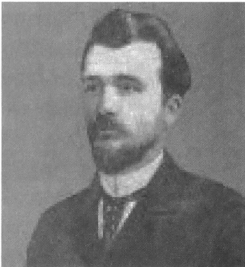
◀ Isidoor Teirlinck, (Zegelsem, 2 januari 1851 - Vorst (Brussel), 27 juni 1934)

Het woordenboek van Teirlinck was nota bene de eerste publicatie over het Bargoens in boekvorm. Het bevatte woorden uit een