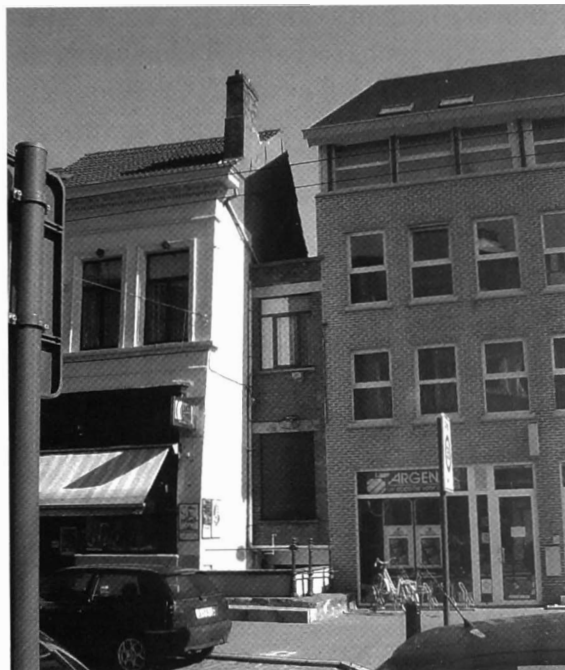
Afb. 3: "Steendam ter hoogte van het Sint-Jansvaardeken"

werden wel meer koeien gehouden tot in het hart van de stad, maar de aantallen gestorven dieren laten uitschijnen dat Heyns geen gewone voerman annex veehouder was. Meer dan waarschijnlijk was hij ook veehandelaar, een beroep dat toen als dusdanig nog niet bestond.