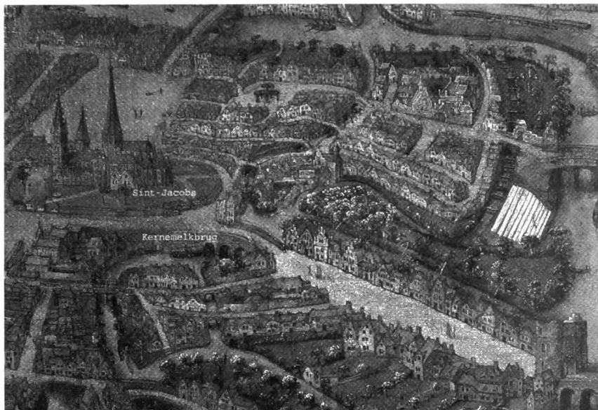
Afb. 1: "Ganda Gallie Civitas Maxima 1534" Gent Bijlokemuseum inv. 474 -

boeren en hoveniers melk en groensels met ezelskerren naar de stad te brengen, en welhaest werd dit gebruik algemeen, tot groot gemak der afgelegene wijken en nog grooter vermaek der straetjongens wier ploeggeest op ezels en boeren zoo geeren zich uitoefent". Voordien werden al deze producten, naast veel andere, naar diverse markten gebracht. De beweringen van onze scribent moeten wel met een korrel zout genomen worden. Het zullen vermoedelijk vooral hondenkarreren geweest zijn, en in 1848 werden er nog zes dagelijkse melkmarkten ingesteld op diverse plaatsen in de stad, maar ze waren geen lang leven meer beschoren. (3) Het verhaal gaat verder als volgt: "Nu in de goeden ouden tyd, als de melk nog ter markt kwam, was er onder de talryke melkboerinnkens van buiten de Dampoort, eene welke uitmuntte in het doopen en brouwen. Daer zy tevens eene doortrapte bedriegster en geestige klappei was, wist zy vooral de dienstmeiden blauwe melk te verkoopen en blauwe bloemekens op de mouw te speten. Lotje was gekend als de kwade penning, en kon een schoon stui-verken opsteken. Doch de volks wysheid zegt: onrechtveerdig goed baat niet. En zoo ging het met onze fopster. De goddelyke rechtveerdigheid kwam haar rekening vragen over zoo vele jaren bedrog en vervalsching. De koebeesten kregen de veeplaeg en stierven, de kinderen werden ziek, de oogst mislukte, de kalanten bleven achter, de ellende stond voor de deur.