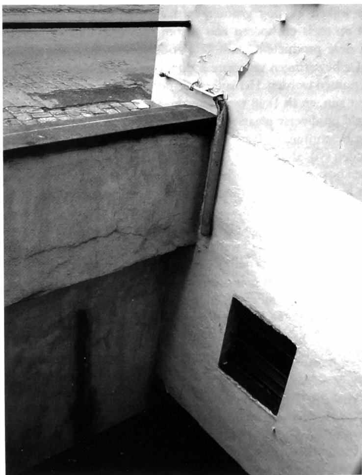
Afb. 2: Het enige anno 2004 nog zichtbare overblijfsel van de Karnemelkbrug aan de Steendam te situeren op afb. 5 net rechts van het naamonderdeel '-brug'. De functie van het zware muuranker is niet duidelijk. Wellicht is het onderdeel van een brugpijler.

Het lijkt er wel op dat ook onze auteur Leeuwke hier duchtig aan het dopen is, niet met water maar met wijwater. Zijn beschrijving is op het randje af potsierlijk moraliserend en als watergeestsage niet erg typisch. Ze kan beschouwd worden als een corrupte versie van een