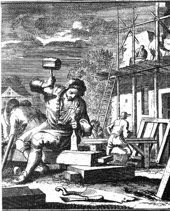
Charpentiers au travail. Gravure de Wiegel, 1698.

Kopie van een gravure van Wiegel-1698 Timmerlui aan het werk