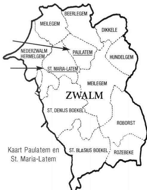
Kaart Paulatem en St. Maria-Latem