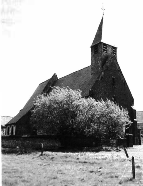
Kerk van Paulatem

Deze kerk was oorspronkelijk een twaalfde-eeuws eenbeukig Romaans kerkje in Doornikse kalksteen. Door het Heilig Kruiskapittel van Kamerijk, dat in het bezit van het patronaatschap van deze kerk was, werd in de jaren 1280-1300 aan dit Romaanse gedeelte een polygonaal koor toegevoegd in Balegemse zandsteen. In de 17e eeuw werd de sacristie gebouwd en ook het dak van de beuk verhoogd, omdat de nok van het koor aanvankelijk hoger was dan die van het schip. (14) Een detailbeschrijving van de constructie van het kerkgebouw met de data der verschillende verbouwingen, herstellingen, aanpassingswerken en het uitzicht van het interieur wordt door Dhanens weergegeven.