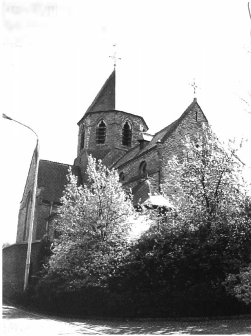
Onze-Lieve-Vrouwekerk van Sint-Maria-Latem.

delijke profilering van een of ander typisch lokaal beroep of lokale activiteit.