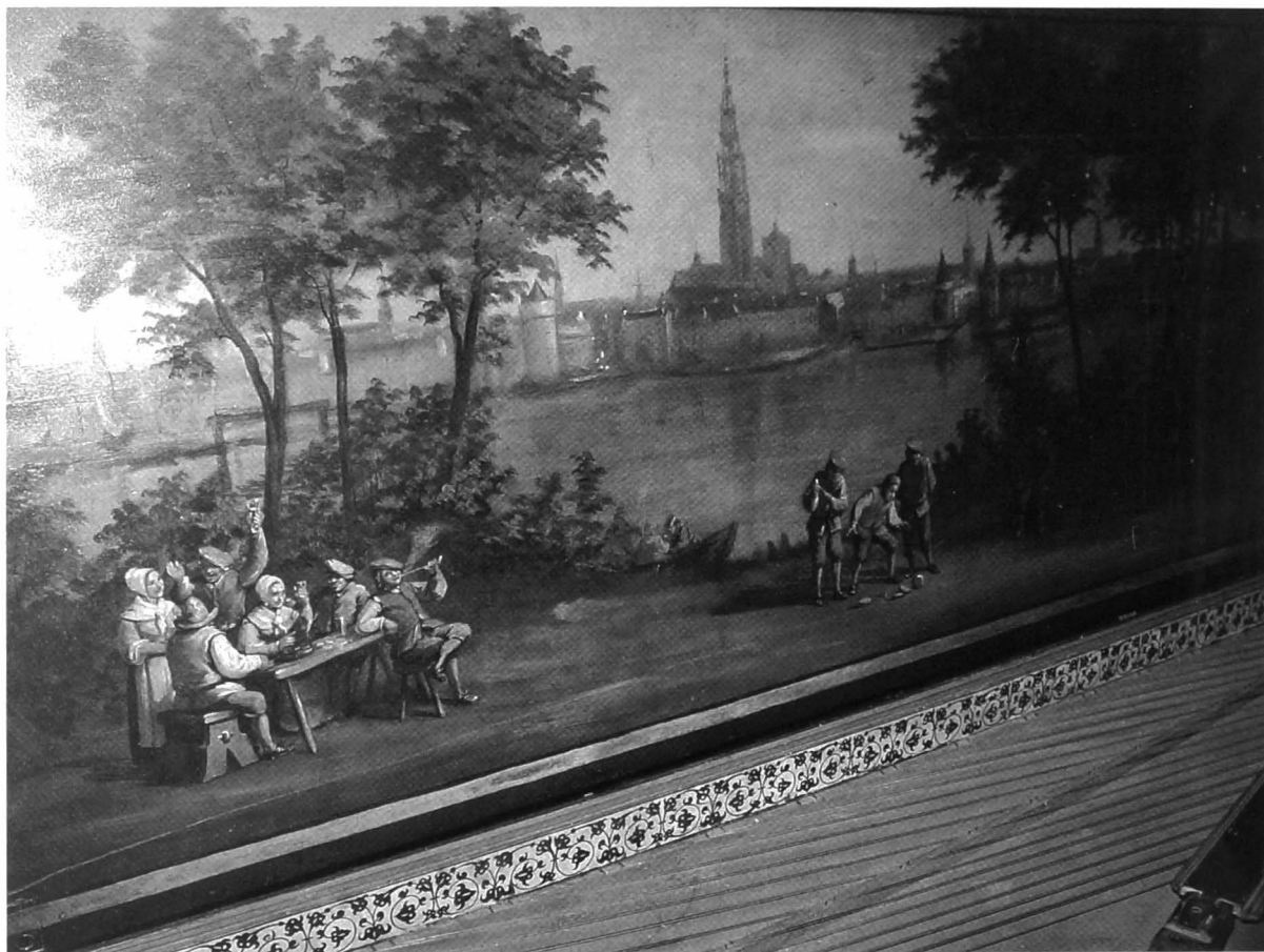
Een schilderij van Antoon Joostens en gemaakt rond 1880.

fervente beoefenaars van dit spel zijn gelukkig dat het nog bestaat. Hun opdracht is overduidelijk: ze moeten alles in het werk stellen om het in ere te houden en het te doen heropleven.