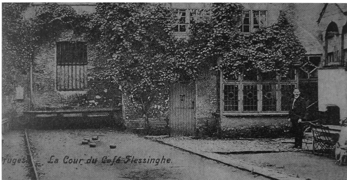
Het oudste drankhuis van Brugge alwaar in de 19e eeuw een bolletra lag en waar de burgerij zeer veel speelde. Renaat van der Linden, KBOV 1966

Een herbergier die zich een beetje respecteerde, deed inspanningen om klanten aan te trekken en ze aan zijn etablissement te binden. Hij offerde veel soorten volksspelen, want de klanten hadden ook behoefte aan vermaak. In vele herbergen kon men deelnemen aan het bolspel. Er waren veel soorten bolspel mogelijk: de pierbol, de ladderbolling, sprietbollen, vloerbollen, de gaibol... en last but not least het trabolspel, ongetwijfeld een der favoriete spelen.